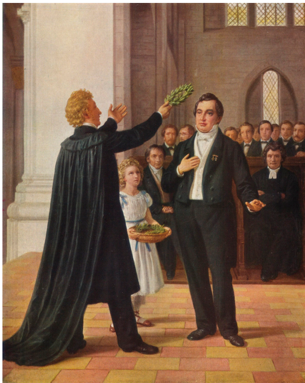
Den danske konstnären Constantin Hansens målning från 1866 föreställande den berömda promotionen i Lund 1829 då Esaias Tegnér lät lagerkröna sin danske skaldekollega Adam Oehlenschläger. Den oidentifierade lilla flickan mellan de båda diktarna torde vara en av de äldsta bilderna av en kransflicka.