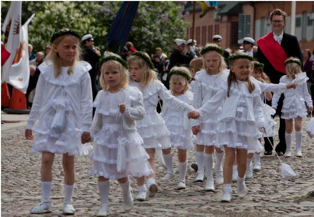
Nutida kransflickor anländer till Domkyrkan med välfyllda godispåsar i händerna alternativt säkert hängda kring halsen.

sin vanliga tjusarkonst. Då han inte kunde roa henne med annat, skrev han sitt namn på programbladet och sade: ”Detta är en autograf. Göm den till minne av farbror Esaias!” Kransflickan gjorde sin knix för den främmande tomten utan att veta, att hon hade framför sig en snillrik vetenskapsman som visste nästan allt som kan hämtas ur språkets urkunder, men ändå mer älskade blommor och barn. 54