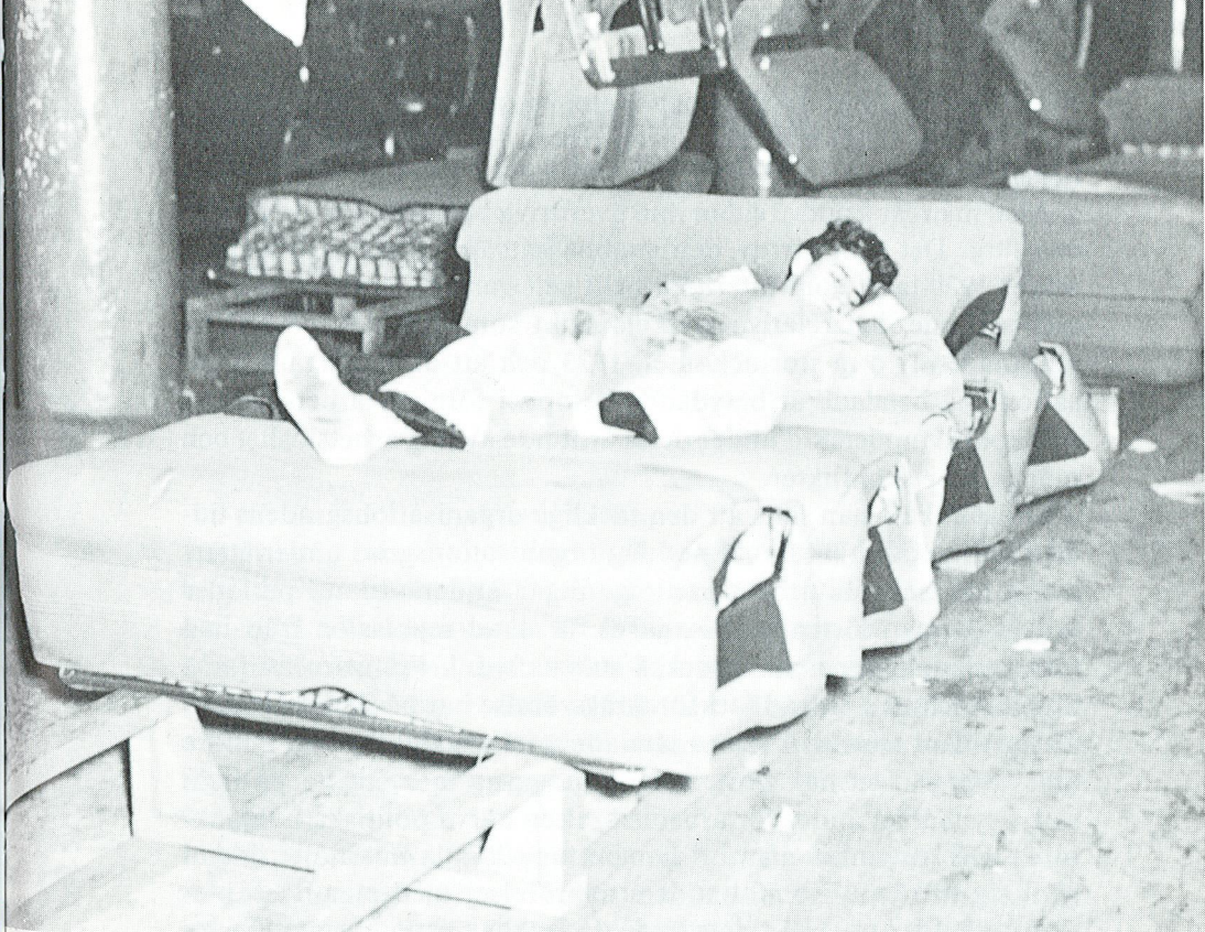
"Sittstrejk" vid General Motors verkstäder i Flint 1937 (ur Turbulent years av Irving Bernstein 1969).

tarrörelsens bredd och samlade styrka. I USA har det saknats starka arbetarpartier, något som fått konsekvenser för fackföreningsrörelsens ideologiska inriktning och möjligheterna att hävda de fackliga idéerna i samhället och hos gemene man. Ibland har de amerikanska fackföreningarna beskrivits som business unions, dvs som snävt inriktade på löneförbättringar och dylikt. I Sverige har däremot den fackliga rörelsen utgjort en integrerad del av en samlad arbetarrörelse som haft ett program för hela samhällets utveckling. Den starka fackliga uppgången under 1930-talet underlättades säkerligen av socialdemokratiens genombrott i politiskt avseende och att många satte sitt hopp till det socialdemokratiska krisprogrammet. Det blev nu närmast en självklarhet att tillhöra en fack-