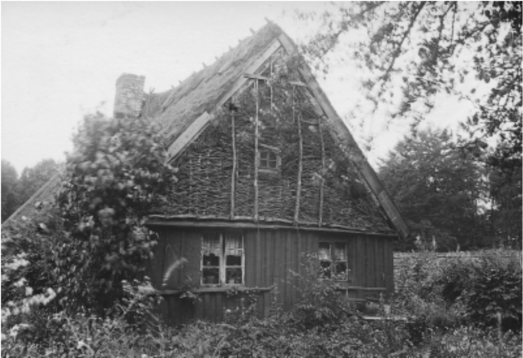
Risflätad gavel i bostadshus, "Smörhuset", Kågeröds socken 1923.

från 1928 behandlar Sjöbeck allmogebebyggelse i den skånska risbygden, kontrasterad mot slättbygdens och skogsbygdens bebyggelse. Han visar i artikeln hur de stora omvandlingarna av risbygden under 1800-talet, då stora områden nyodlades, inte bara förändrade kulturlandskapet utan också medförde att allmogens byggnader fick nya gestalter. Sjöbeck refererar också till lantmäterikartor. Sigurd Erixon ansåg dessa bristfälliga som källor vid bebyggelsehistoriska studier, eftersom det i dem inte går att utläsa de enskilda husens byggnadsteknik och byggnadstyp (Erixon 1919:1). Sjöbeck nyttjade emellertid äldre kartor över Luggude härad för att utröna i vad mån samtida 3- och 4-längade gårdar i äldre tid hade varit 2- eller 3-längade, och han kunde belägga att samtida fyrlängade gårdar till en början endast haft två eller tre längor (Sjöbeck 1928a:84).