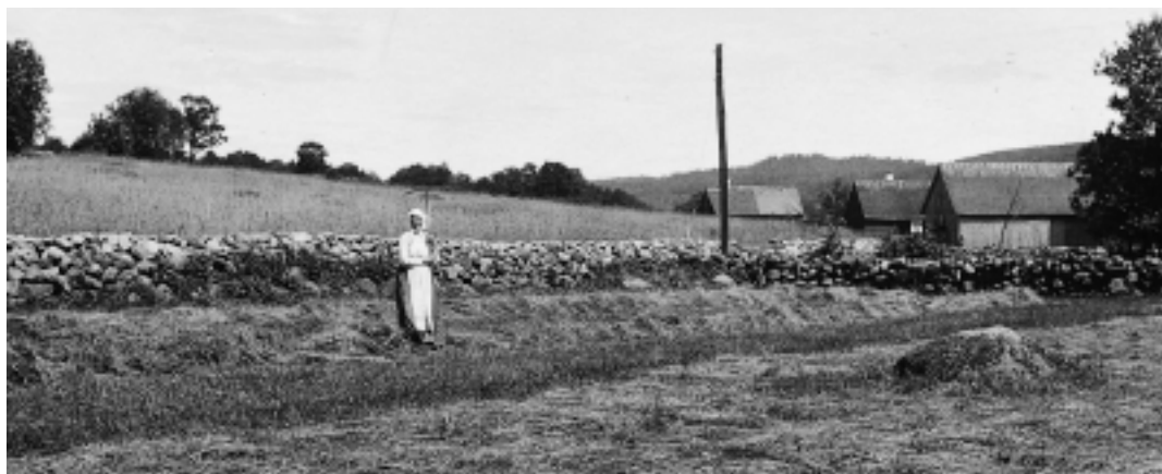
Bilden publicerad första gången 1927 med följande bildtext: Naturlig äng i Nösvala by, Brönnefads s.n. Iförgrunden ligger höiet utbrettp till torkning i sträng. I bakgrunden håller kvinnan på med ”att slå ihoba en sträng” till en ”soba”.