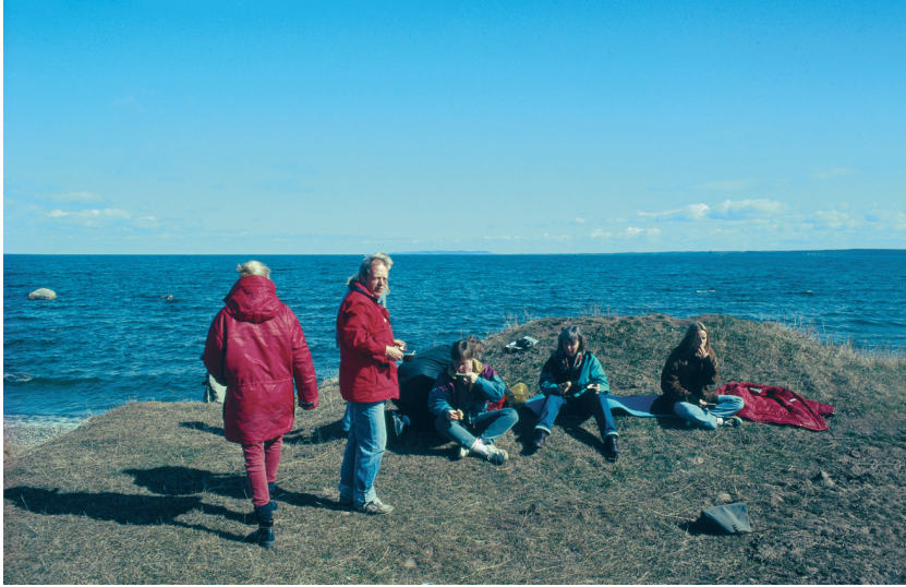
Fig. 2. Delar av projektgruppen på Visingsös nordspets våren 1994. I fjärran skymtar Omberg.

En flygfotografering av undersökningsområdet vid Alvastra företogs under våren 1994. Ett av de viktigare resultaten av denna var att läget för den ovan nämnda Alvastra by, som nerlagts på 1600-talet, nu kunde närmare lokaliseras.