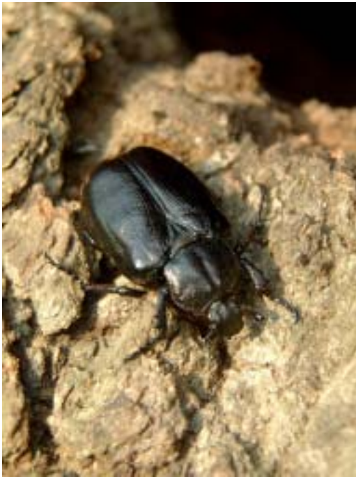
Figur 1. Läderbaggen ( Osmoderma eremita ) sittande på en ek i Tinnerö-området strax söder om Linköping i Östergötland.

Hermit beetle on an oak south of Linköping in the county of Östergötland.