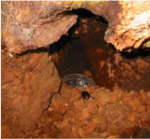
Figur 4. Fallfälla i hålighet i gammal ek på Hallands Väderö.

Pitfall trap in an old hollow oak on the island Hallands Väderö.