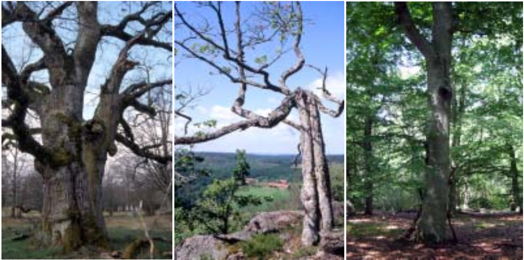
Figur 3. Ekar ( Quercus robur ) från Brokind och Knastraberget (Kinda), Östergötland och bok ( Fagus sylvatica ) på Hallands Väderö, Skåne, vilka alla utgör värdträd för läderbaggen ( Osmoderma eremita ).

Oaks from the county of Östergötland and a beech from the island Hallands Väderö, which all are host tree for hermit beetle.