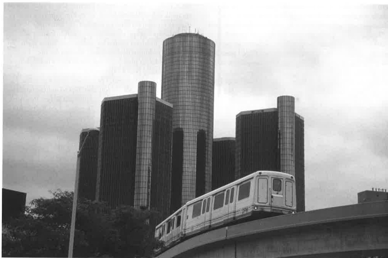
"Detroit Downtown People Mover". förslår inte långt. I Detroit, känd för sin omfattande biltillverkning, är de allmänna kommunikationerna urusla och detta utgör ofta ett hinder för människor att ta sig till möjliga arbetsplatser.

Styrmedlen består i hög grad av incitament – piskor och morötter. Filosofin kan sammanfattas som att det ska löna sig att arbeta men inte löna sig att inte samarbeta.