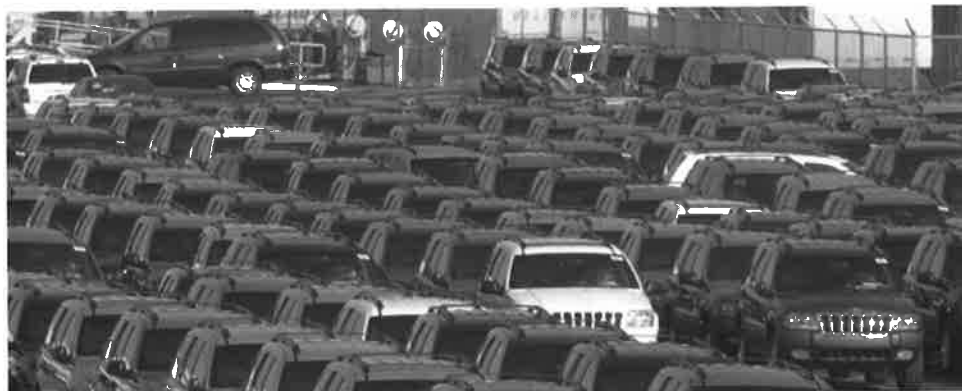
Framför Daimlerchryslers monteringsfabrik på Jefferson Avenue i Detroit står rader av färdiga jeepar. Upp- och nedgångar i bilförsäljningen lämnar tydliga spår på Detroit's arbetsmarknad.