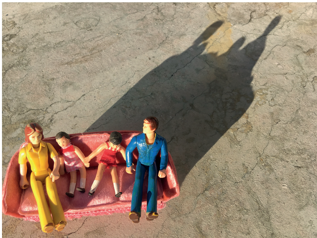
Hemmet är fyllt med verktyg för att skapa ”mitt” eller ”vårt” – soffor, skrymslen, läs, köksbord och mobiler.