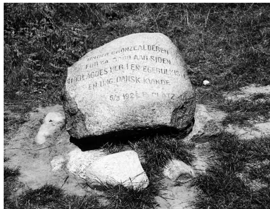
Fig. 9. Mindestenen over fundet af Egtvedpigen.