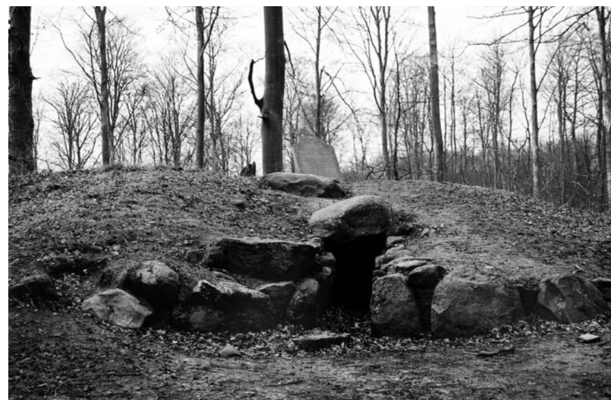
Fig. 2. Jættestuen ved Jægerspris med mindesten fra 1744, som måtte fornyes i 1943 og 1995. – Foto: Jes Wienberg 2007.

Mindesmærker optræder i 1700-1800-årene på pladser, hvor kongelige har bedrevet arkæologi. Som ved andre af tidens mindesmærker er fyrsten her i centrum, mens oldtiden og arkæologien danner en glansfuld kulisse. Mindesmærker over kongen eller greven, der var arkæolog, rejses i 1800-årene, hvor de har været aktive. Mindesmærker for historiske personer rejses i årtierne omkring 1900 ved fortidsminder, som er knyttet til deres navne, og hvor nog-