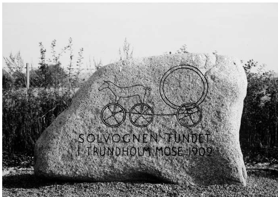
Fig. 1. Mindesten nær findestedet for Solvognen i Trundholm Mose.