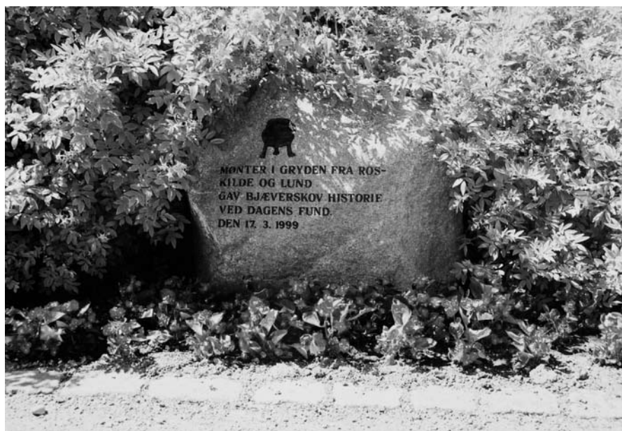
Fig. 10. Mindestenen over møntskatten i Bjæverskov. – Foto: Jes Wienberg 2005.

Monument at the find site for the coin hoard at Bjæverskov.