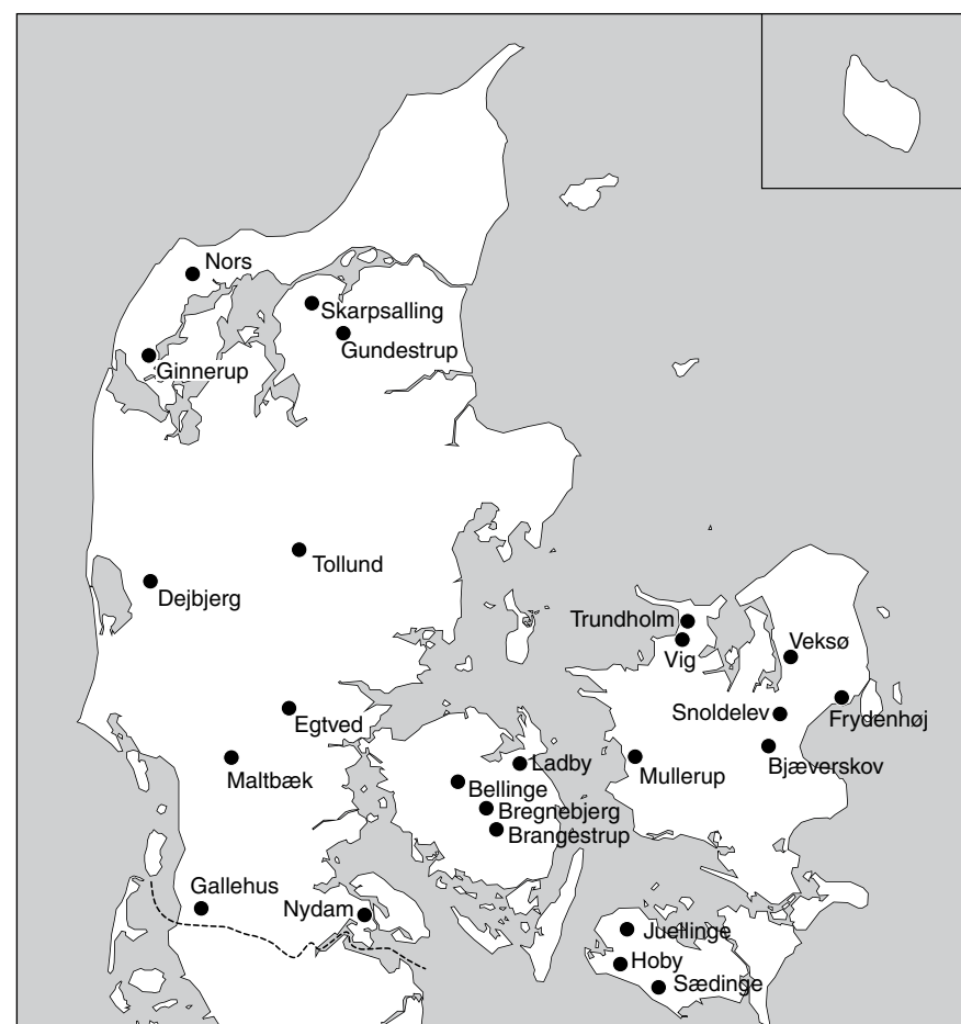
Fig. 6. Mindesmærker ved arkæologiske fundpladser i Danmark.

Monuments at archaeological find sites in Denmark.