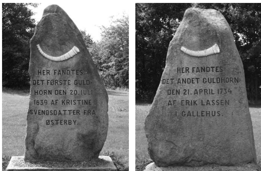
Fig. 7a-b. Mindesten i Gallehus for fundet af Guldhornene.

Fundene, som er blevet markeret med mindesmærker gennem 1900-årene, repræsenterer flere kategorier end den tidligere nævnte top-ti-kanonliste. Her findes rigtignok sager af guld, sølv og bronze, offerfund i moser, skattefund og rige grave, bemærkelsesværdige eller enestående fund. Men her forekommer også bopladser, en brandgravplads, to runesten, et moselig og et dyreskelet.