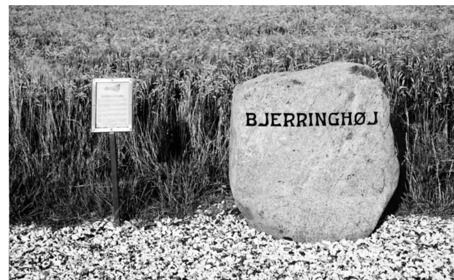
Fig. 5. Mindesten ved Bjerringhøj rejst i 1989.