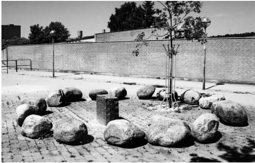
Fig. 8. Mindesmærke ved findestedet for Frydenhøjsværdet på Avedøre i Hvidovre. – Foto: Jes Wienberg 2005.

Monuments at the find site for the Frydenhøj sword at Avedøre in Hvidovre.