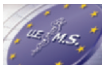
Utbildningsplanen gäller för alla medlemsländer i UEMS.

Dokumentet blev därmed del av den europeiska lagstiftning som är ägnad att harmonisera bestämmelser inom EU. Tanken är att såda-