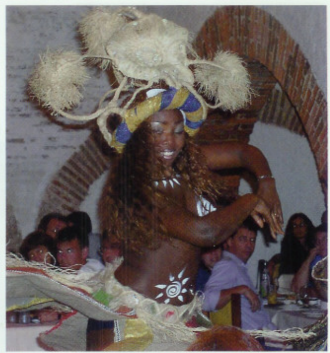
Candomblé-danserska uppträder på en fest.

"Igreja NS do Bonfim" (1745), där såväl katolska som afrikanska religiösa ceremonier äger rum (t v).