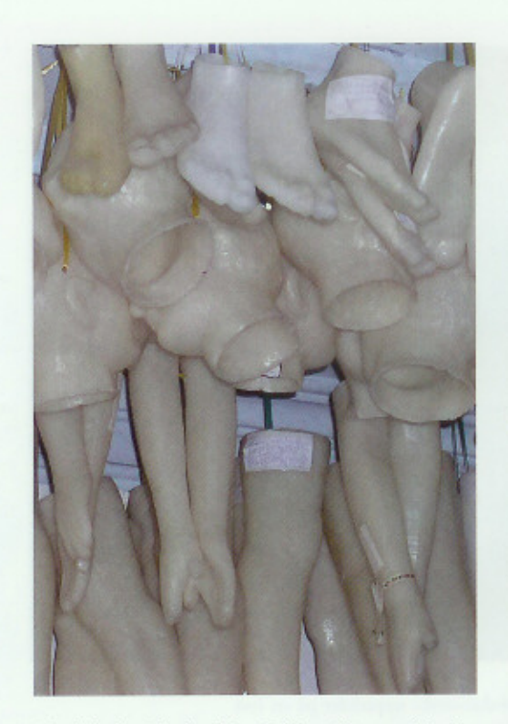
Mirakelsalen i kyrkan "Bonfim", med kroppsdelar i vax hängande från taket, donerade av sjuka och tillfrisknade troende.

Sjöfartskyrkan "Nossa Senhora do Boa Viagem" från 1712 (t v).