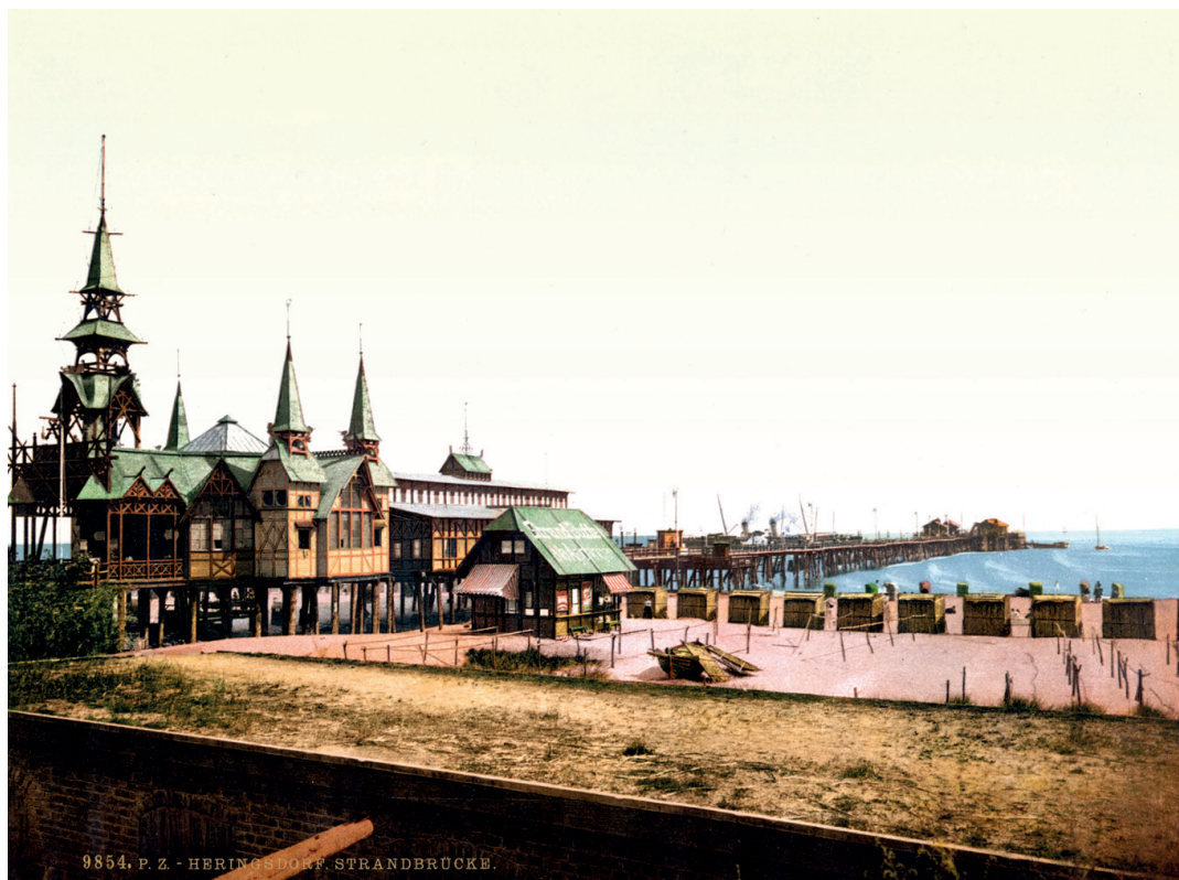
Pir i östersjöhavsbadet Heringsdorf, Tyskland, ca 1895.

1890-talet i Tyskland hade pirarna många fler funktioner än att bara vara anläggningsbryggor för båtar. De spelade en central roll i det sociala havsbadlivet. I större havsbad bar de stora, antingen pampiga eller pittoreska, byggnader som tjänade som entré till piren och hyste caféer, restauranger och affärer (Gildenhaar 1993; Walton 1983 s. 173 f.). Konserter ägde rum på pirarna. Folk brukade promenera på dem och visa upp sig; pirarna blev på så vis en förlängning och central del av strandpromenaden.