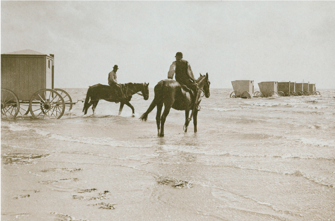
Badkärror i Wyk på nordsjön Föhr, Tyskland. Foto: Wilhelm Dreesen 1895. Wikimedia Commons.

omklädningshytt på hjul i vilken badgästen drogs ut i vattnet av hästar, bad-drängar eller badpigor. Där öppnade den badande dörren, klev över en stege ner i havet och kunde hålla sig i ett rep som var fäst vid badkärran. För att inte synas kunde man dra ner en stor paraply fram till vattenytan som fanns på ena sidan av badkärran. På så sätt erhöll man ett eget avskilt litet badrum i havet. Här skulle man doppa sig enligt reglerna flera gånger i det kalla vattnet, helst före frukost.