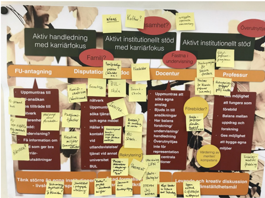
Fig. 2: Resultat av workshop

Workshopparna gav tillfälle att dels kommunicera och få respons på resultaten från intervjuer, dels skapa möjligheter för direkt erfarenhetsutbyte mellan fakulteter, dels stimulera samtal kring behov och förslag på lokalt förändringsarbete. Workshoppar av den här modellen kan alltså med fördel betraktas som ett viktigt instrument för att utveckla jämställdhetsarbetet inom universitetet som helhet och inom dess olika delar.