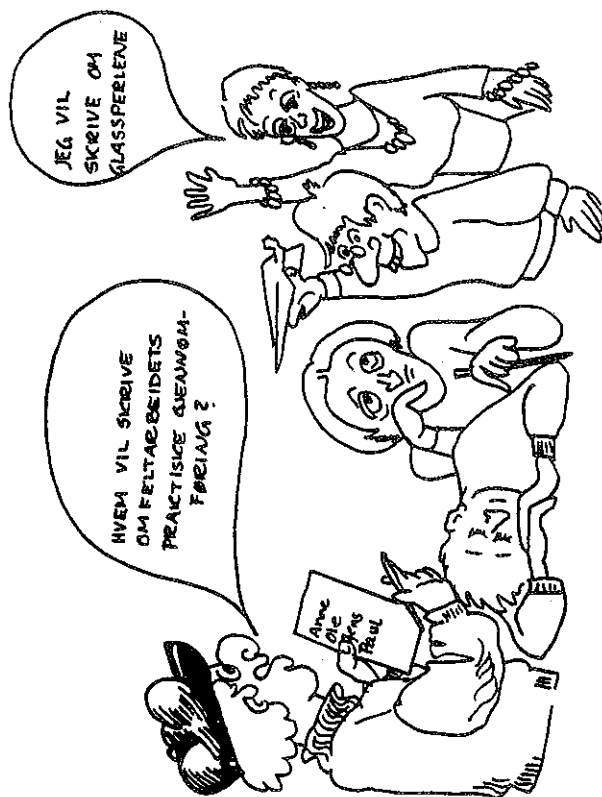
Den redigerede rapport

Nej, problemerne er velkendte, diskuteres ofte, men opfattes måske sjældent på tryk, da de tilhører en praksis, som anses videnskaben uved-