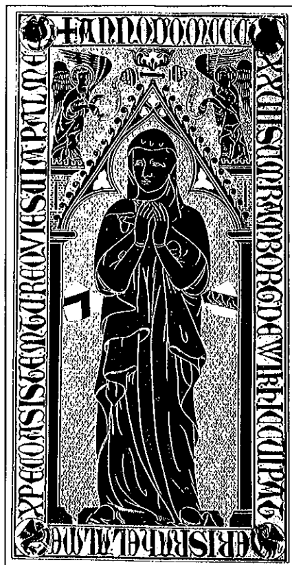
Fig. 2. Gravplade over Ramborg Israelsdotter til Vik i Væsterdøker kirke. En lang indskrift fordelt over messingpladen, gravnichen og gravens forside beretter om den driftige og selvbevidste kvinde:

"Herrens år 1327 år jag, Ramborg till Vik, här, vars fader var Israel. Hulde Kristus bistå mig. Du är vilan och fridens väg.