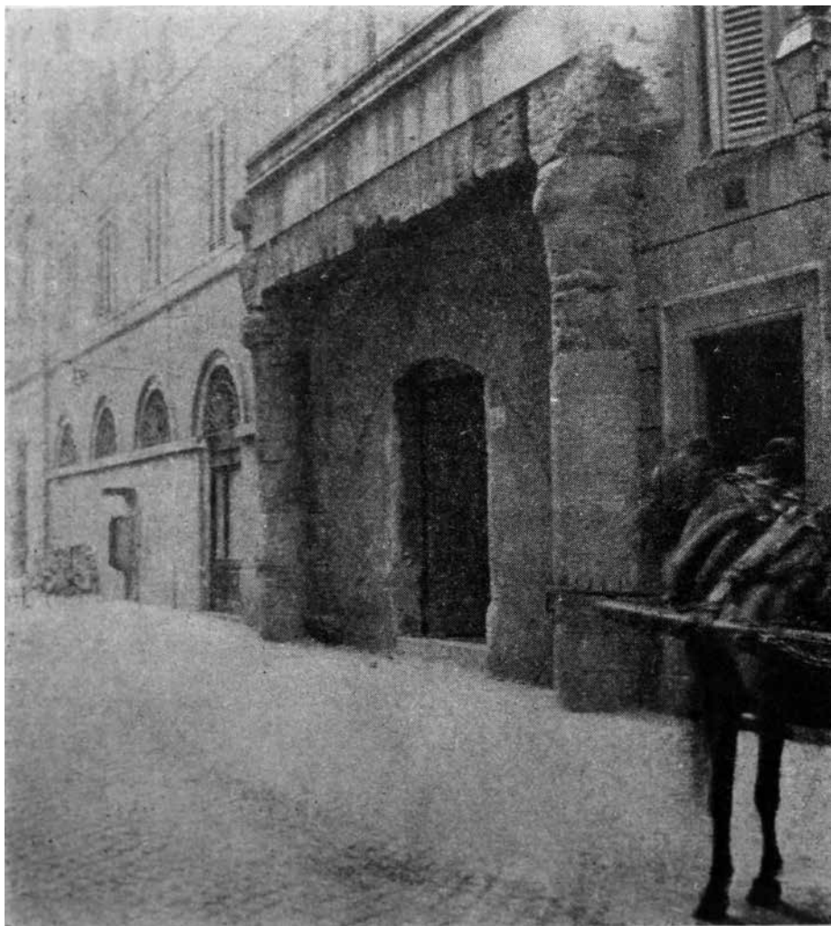
Ruinen på Via di S. Maria de' Calderari. Ur Undersökningar i Roms topografi (1929), s. 68.