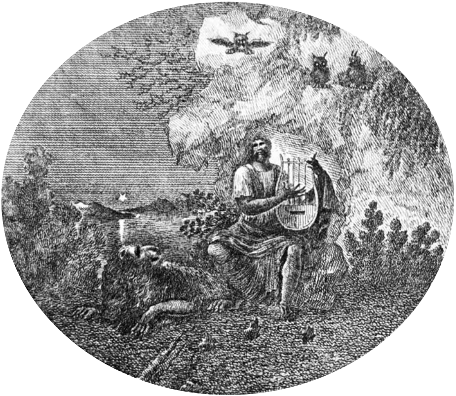
Den spelande Orfeus: titelvinjett för Phosphoros, utförd av Jacob G. Klingwall.

av en ambition att se anden i den klassiska kulturen. 83 Avståndet till antiken i rum och tid borde genom tolkning göras produktivt. Den vinjett som återkommer på Phosphoros försättsblad framställdes ursprungligen för Orphika och föreställer den spelande Orfeus; det är mörkt och i bakgrunden anas morgonstjärnan (Phosphoros). Ikonografin kan emellertid tillskrivas samma dubbelhet som tidskriftens antiköversättningar: vid Orfeus fot vilar lejonet, det vilddjur som stillas av hans sång. Men lejonet är också en Kristusymbol – lejonet av Juda stam – och den gryende morgonstjärnan kan tillskrivas rollen som Betlehemsstjärna. 84