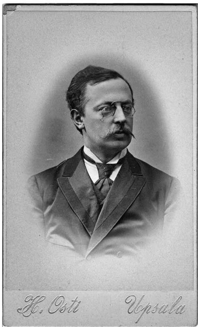
Vilhelm Lundström (1869–1940), år 1900.