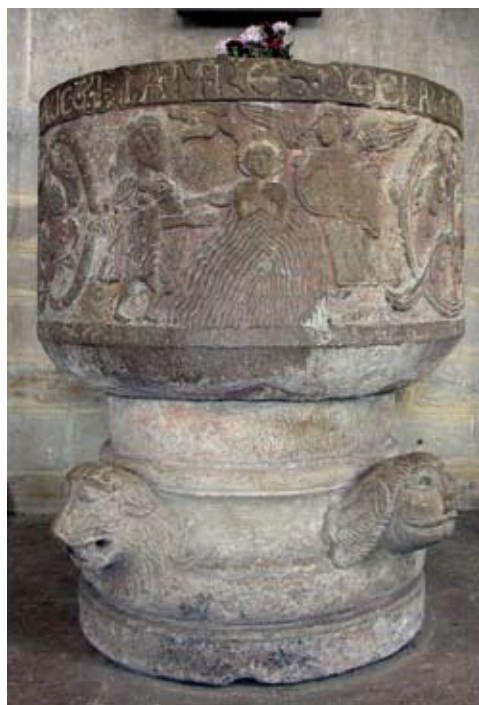
Fig. 3. Dopfunten i Dalby. Foto Ing-Marie Nilsson, 2010.

Dopfunten i Dalby är i flera avseenden ett exceptionellt arbete (fig. 3). Den har tillverkats av skickliga stenhuggare med kännedom om den internationella romanikens form-