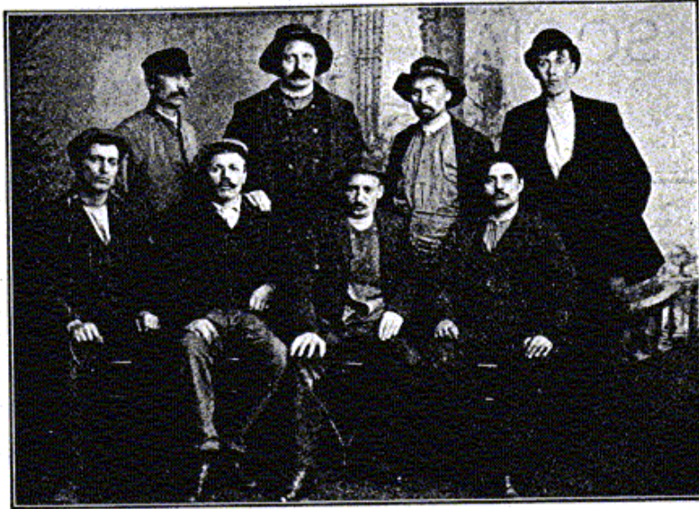
En gruppbild av undersökarna.