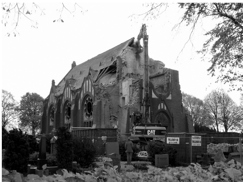
Fig. 1. Maglarps nya kyrka rivs. Foto: Ingemar Krigström, Regionmuseet i Skåne, 2007.

Maglarps nya kyrka revs 2007 efter årtionden av förfall, osäkerhet och konflikt (fig 1). Kyrkan invigdes 1909 som en av de sista stora nybyggnationerna på den skånska landsbygden. Den gamla medeltidskyrkan kunde då mycket väl ha rivits, men fick stå kvar i byn; den användes som bröllops- och sommarkyrka. Efter en grundlig arkeologisk undersökning och restaurering togs Maglarps gamla kyrka åter i bruk 1971. Nu passade den åter församlingens behov. Församlingen använde båda kyrkorna under några år, men 1976 övergavs Maglarps nya. Den nya kyrkan på slätten hade blivit övertalig och förföll gradvis. Redan 1968 upphörde allt underhåll och 1999 ansökte församlingen om rivning, men fick avslag. Efter olika omgångar gav regeringsrätten 2005 församlingen tillstånd att riva Maglarps nya, trots att länsstyrelsen hade önskat en restaurering och fortsatt bruk. Kyrkan avsakraliserades 2006 och revs året därpå (Alftberg & Eriksson 2008; Brohed 2008; Sjöström 2008a).