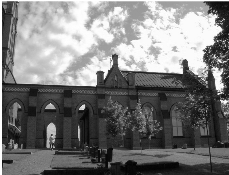
Fig. 4. Trönö nya kyrka efter brand och restaurering. juni 2007.

den mäktiga gotiska kyrkan. Ryssby kyrka utanför Kalmar brann 2001. När den återinvigdes 2005 hade läktaren utökats med olika rum för församlingens behov på bekostnad av själva kyrkorummet. Ett annorlunda exempel är Trönö nya kyrka i Hälsingland, som även den brann 1998. När kyrkan återinvigdes 2001 var det med en »lillkyrka« och en öppen förgård innanför de bevarade murarna (fig. 4). Vidare kan nämnas Lima kyrka i Dalarna, en kyrka från 1865, där den västra del avskärmades som ett församlingsrum efter en renovering 2005. Mera allmänt ser man en tendens till att förnya kyrkornas inredning, skapa mer flexibla kyrkorum, t.ex. genom borttagande av bänkrader.