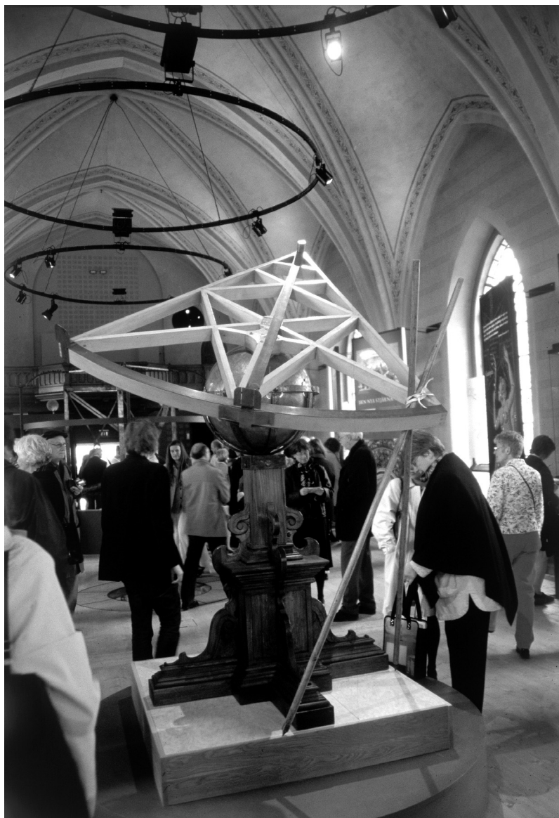
Fig. 5. Vens nya kyrka omvandlad till Tycho Brahe-museum. Foto: Jens Velle, april 2005.