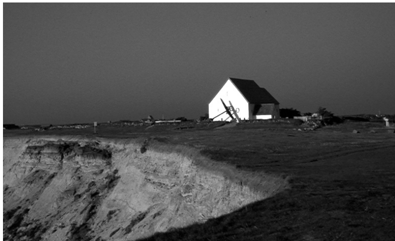
Fig. 7. Mårup medeltidskyrka vid avgrunden. Foto: Jes Wienberg, juli 2006.

medeltidskyrkor och togs åter i bruk. Riksantikvarieämbetet drev en kampanj för att ödekyrkor efter restaurering skulle bevaras som just kyrkor (Elmén Berg 1997; Wienberg 2006, s. 64f.). Rivning var således den vanligaste strategin i Skandinavien, i samband med att en kyrka skulle förnyas eller blev övertalig fram till tiden för Första världskriget.