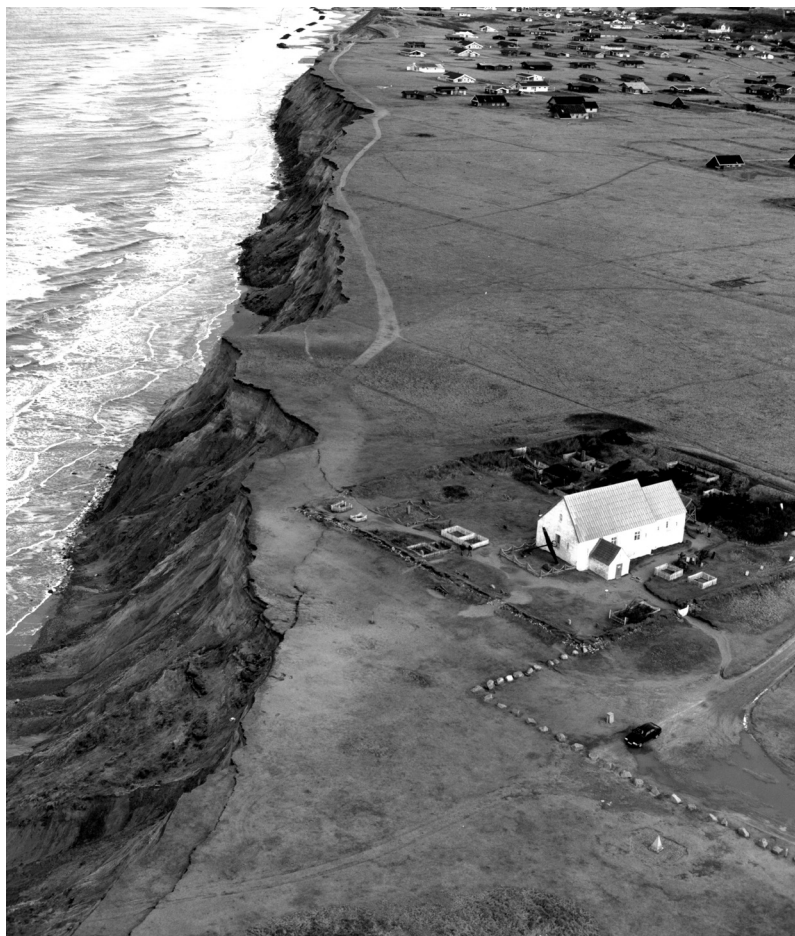
Fig. 3. Mårup medeltidskyrka på klinten i Nordjylland. Foto: Hans Hunderup, Hunderup Luftfoto i Hjørring, mars 1998.