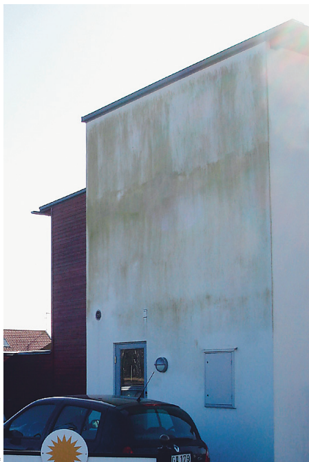
Bild 3: Fasad några månader efter behandling med algvättningsmedel.