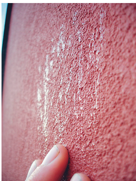
Bild 2: Vänster: kondens på ytan av fasad med tunnputs på isolering, höger: ingen kondens på fasad av tunnputs på tegel. Bild tagen en morgon i oktober månad 2007.