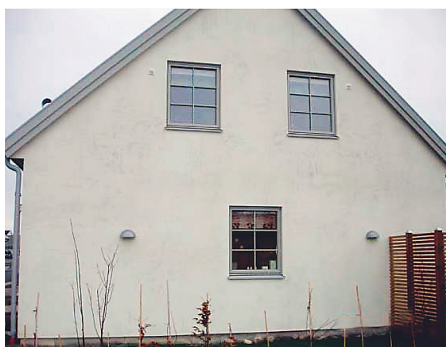
... och mögel.