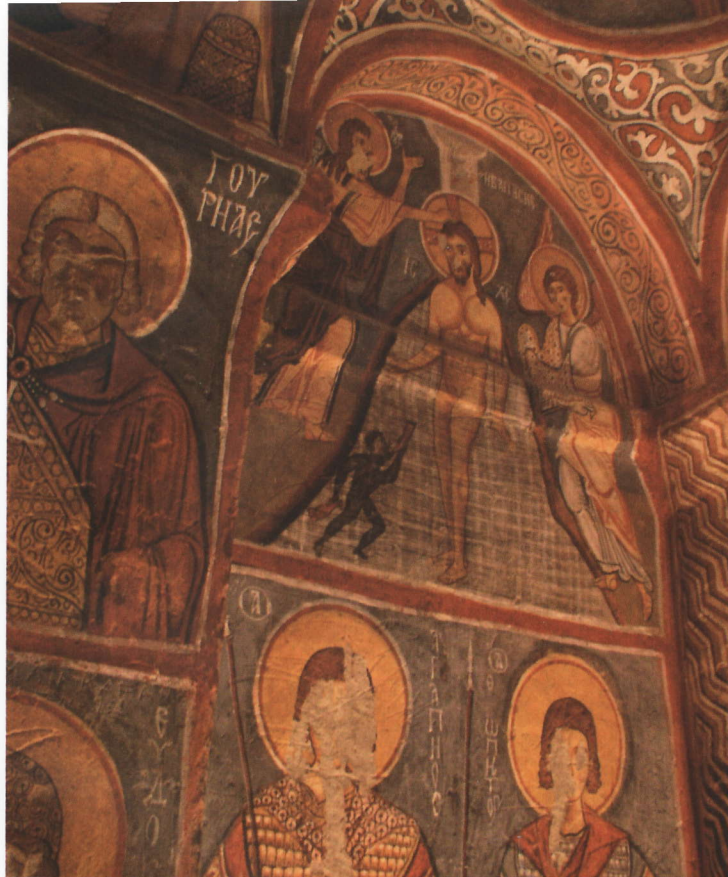
Skiss över underjordisk stad där 2 markerar nedgångar och 4 ventilations-trummor. (ovan t h)