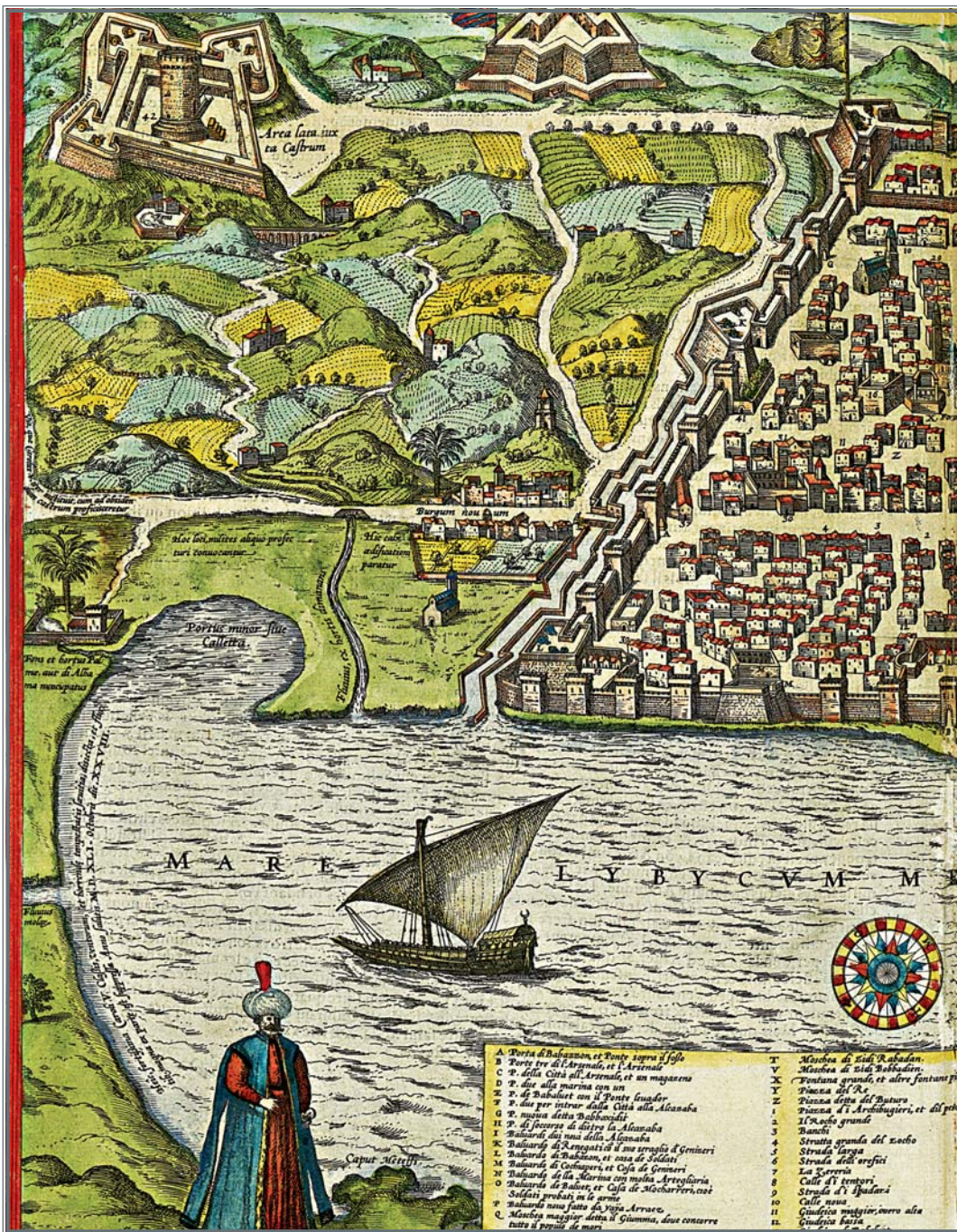
La puissante régence d'Alger au XVIIème siècle.