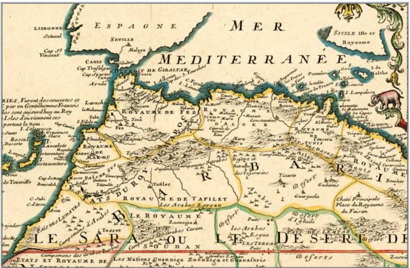
L'Afrique du Nord avec Fez et Alger (1709).

général on ne leur prête aucune autorité et leur justice est communément méprisée, au point qu'il est fréquent qu'ils n'aient pas accès au tribunal 76 . L'empereur ne réagit pas à cela, d'autant que, par la force, il n'obtiendrait rien de cette association de malfaiteurs ; une domination plus lâche lui est nettement plus profitable, surtout contre les chrétiens.