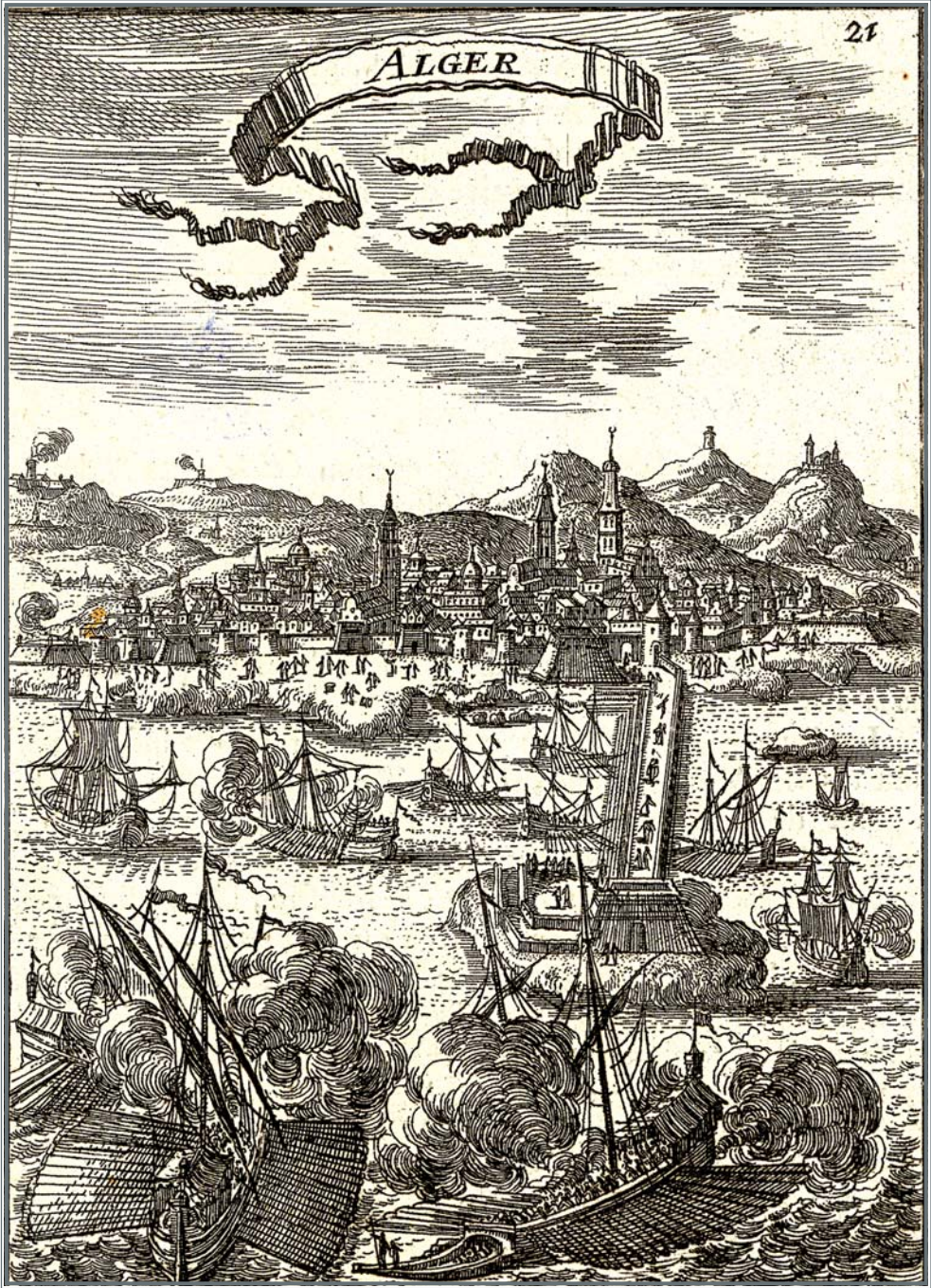
La port d'Alger. Impression ancienne.