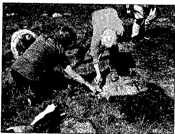
Fig. 1. Sedan många år arrangeras sommarkurser i arkeologi på Åsa folkhögskola av Södermanlands hembygdsförbund i samarbete med Länsstyrelsen Södermanlands län. Temat för årets kurs var bronsålder. Man sökte bl.a. upp några av länets hållristningar och hittade flera nya figurer i anslutning till dem. På bilden kritmålade skålgropar och en hjulkorsfigur.

Arkeologer och antikvarier inom kulturmiljövård har till uppgift att verkställa lagstadgade föreskrifter om vård och bevarande av kulturmiljöer, och att utföra arkeologiska undersökningar av hotade kulturlämningar. Arkeologer och museipedagoger inom museibranschen bygger utställningar och producerar informationsmaterial och gör på olika sätt arkeologin tillgänglig för flera människor (fig. 1). På universiteten sker utbildning i arkeologi, och vi vet att personer med arkeologutbildning har arbete långt utanför arkeologins egna verksamhetsområden. Arkeologisk forskning sker inom uppdragsarkeologin och inom universitetsmiljöerna. Forskning innebär ett ständigt ifrågasättande och en granskning av filosofiska ansatser och vetenskapsteoretiska utgångspunkter för våra tolkningar av arkeologiska fynd och fornlämningar. Arkeologi går inte att mäta. Arkeologi kan inte mätas i volymer, antal arbetstimmar, antal kilo flinta eller antal utgrävda gravar. All arkeologi består av fragment eller skärvor av kunskap och insikt. Ambitionen för arkeologer är att sammanfoga dessa fragment och