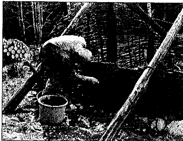
Fig. 3. Vrå Forntidsby utanför Katrineholm byggdes av Föreningen Vråfolket på 1980- och 1990-talen intill stenåldersboplatsen vid Östra Vrå, som delundersöktes på 1930- och 1990-talen. På bilden lerklinas den risflätade väggen på ett av husen. I föreningens regi har många skolklasser fått uppleva att leva stenåldersliv på platsen.