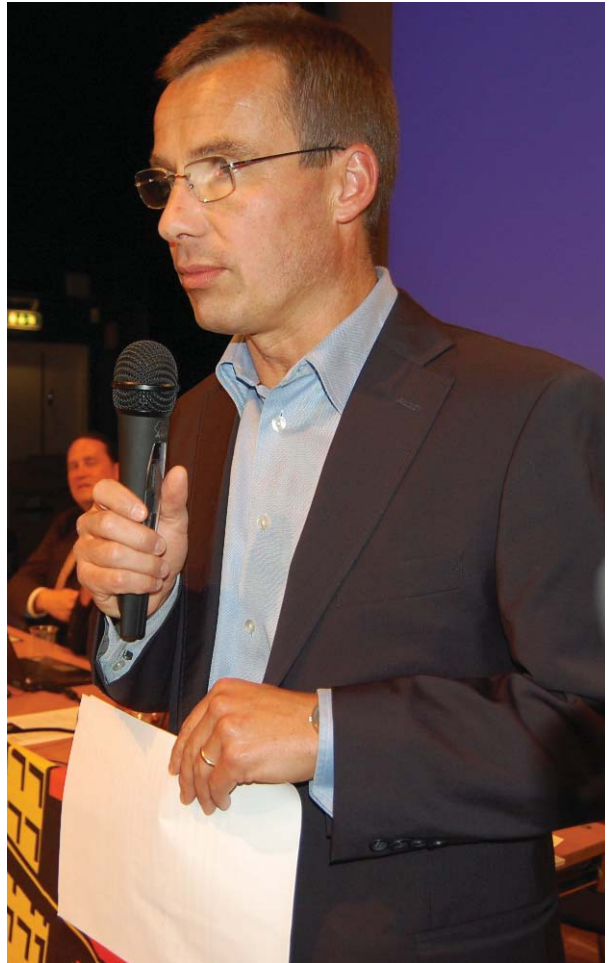
Ulf Kristersson öppnar mötet i Rinkeby Folkets Hus

Jag råkade vara i New York i samband med borgmästarens förra "State of the City"-anförande. Han påpekade då inte bara hur internationaliserat New York har blivit och vill fortsätta vara, utan också på hur fundamentalt detta är för att förstå vad som händer i USA idag. "Den här staden är byggd på illegala invandrare. Jag tänker inte agera spion åt de federala myndigheterna så länge människor som bor här sköter sig och gör rätt för sig", var Bloombergs beskrivning av Executive Order no. 41 som för några år sedan klaggjorde att New York inte kommer rota i människors papper så länge de följer lagen och gör som man ska i New York. Han har respekt för säkerhetsfrågor och antiterroristbestämmelser, men New York kan inte svika de rötter som gjort staden till en av världens mest framgångsrika och attraktiva. Så fungerar ett riktigt internationaliserat samhälle.