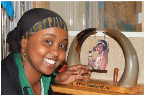
Nimo och ”Afrikas horn”.

De tre amerikanernas vistelse i Sverige mjukstartade 25-26 augusti med närvaro vid den årliga Afrikas Horn-konferensen i Lund, arrangerad av SIRC. Första anhalt på turnén var sedan Roskilde Universitetscenter där ett seminarium avhölls vid Institut for Samfund og Globalisering. Nästa dag gick turen till