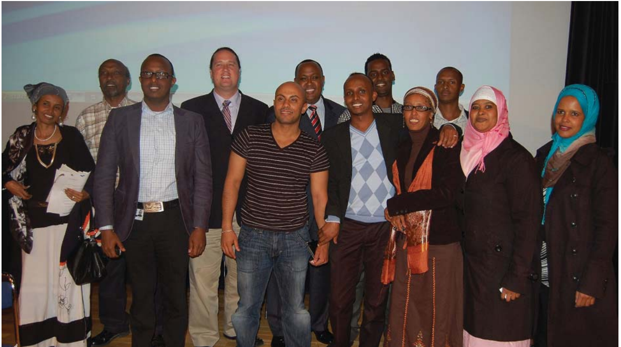
Rinkeby Folkets Hus: Amerikansk-svensk-somalisk förbrödring

Amerikanska ambassaderna i Stockholm och Köpenhamn Somalia International Rehabilitation Center (SIRC) Institut for Samfund og Globalisering, Roskilde Universitetscenter Göteborgs Initiativet Migrationsverket Malmö stad Sociala Missionen Stockholms stad Svenskt Näringsliv