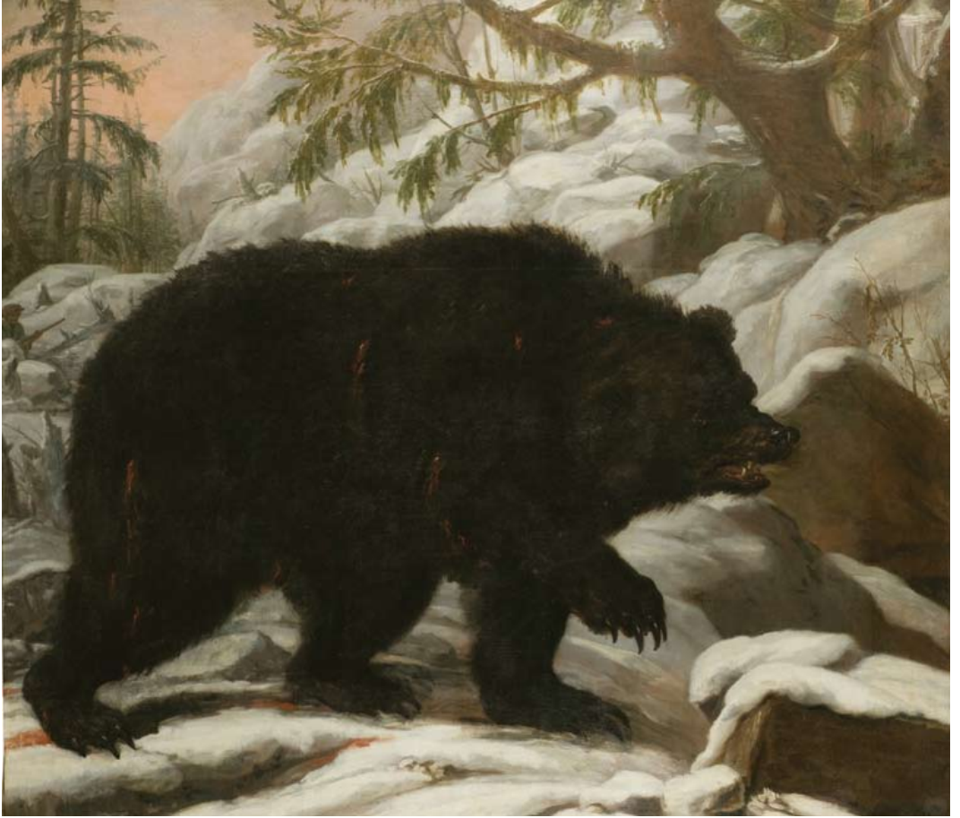
9. David Klöcker Ehrenstrahl, Sickelsjöbjörnen (1681).