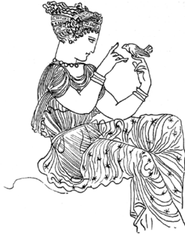
Antik vasmålning föreställande kvinna med sparv ur Dionysischer Reigen (1926).

explicit”, skriver den engelske utgivaren av romarens dikter G. P. Goold och tillägger: ”the passer of II and III is not really Lesbia’s sparrow but symbolically represents the poet’s organ.” 58