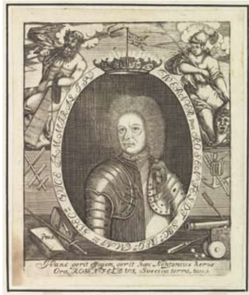
6. Werner von Rosenfelt (1639–1710) iförd rustning och omgärdad av nautisk-militärisk ikonografi; kopparstick (ca 1690), okänd konstnär.