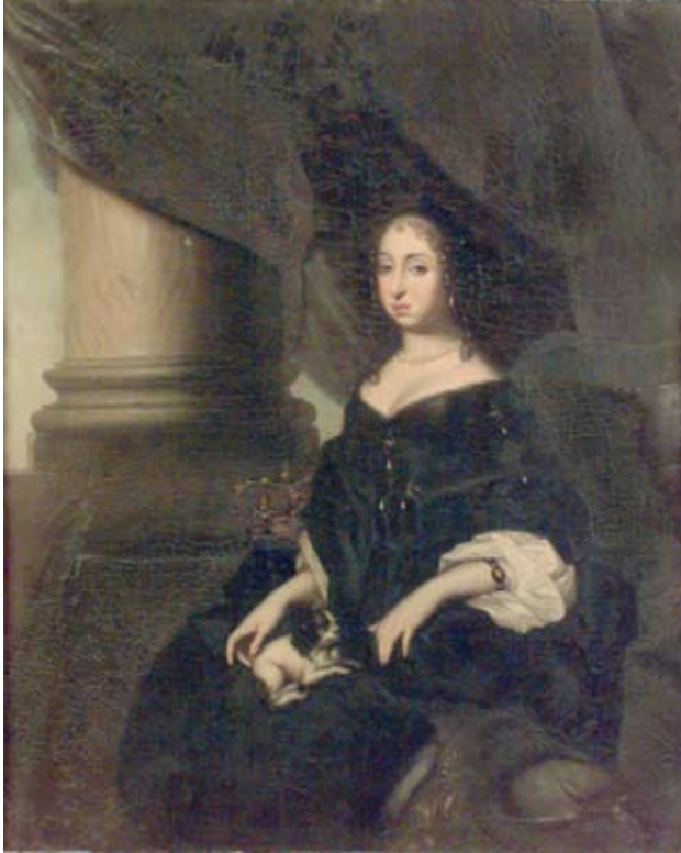
2. David Klöcker Ehrenstrahl, porträtt av änkedrottning Hedvig Eleonora (1636–1715) med knähund.