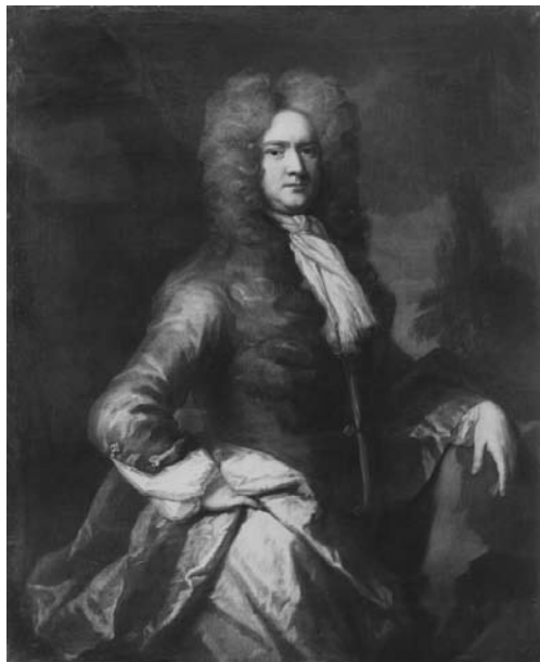
7. Porträtt av Christoffer Leijoncrona (1662–1710). Målning av Michael Dahl d.ä. (ca 1700).