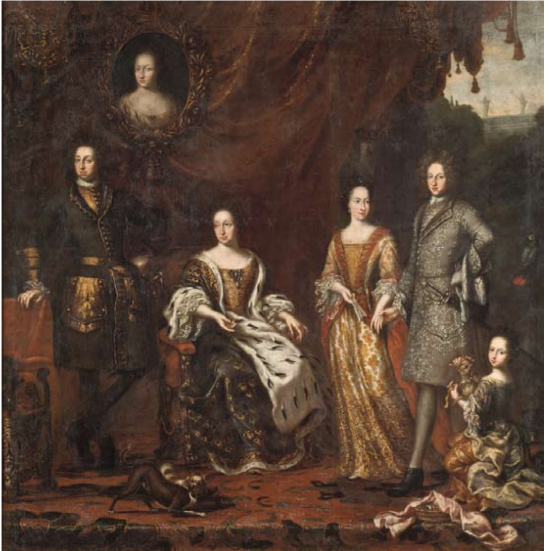
5. David Klöcker Ehrenstrahl (tillskriven), Karl XI, konung av Sverige, med familj (1697) Ulrika Eleonora d.y. håller en knähund i famnen och till höger om den blivande Karl XII sitter en papegoja.