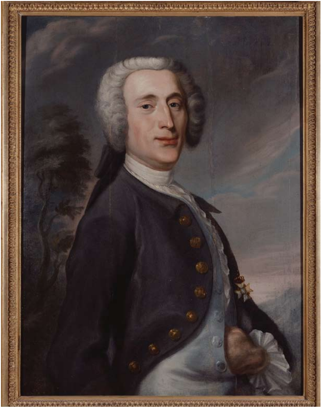
8. Johan Joachim Streng (1707–1763), porträtt av Olof von Dalin (1708–1763).