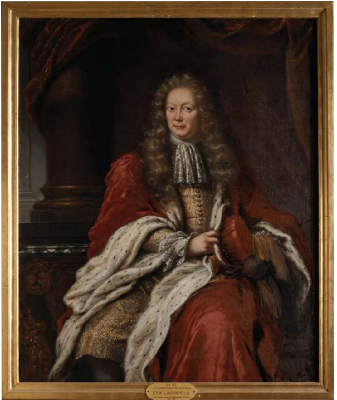
1. Porträtt av Erik Lindschöld (1634–1690). Målning utförd 1690 av hovmålare David Klöcker Ehrenstrahl (1628–1698).