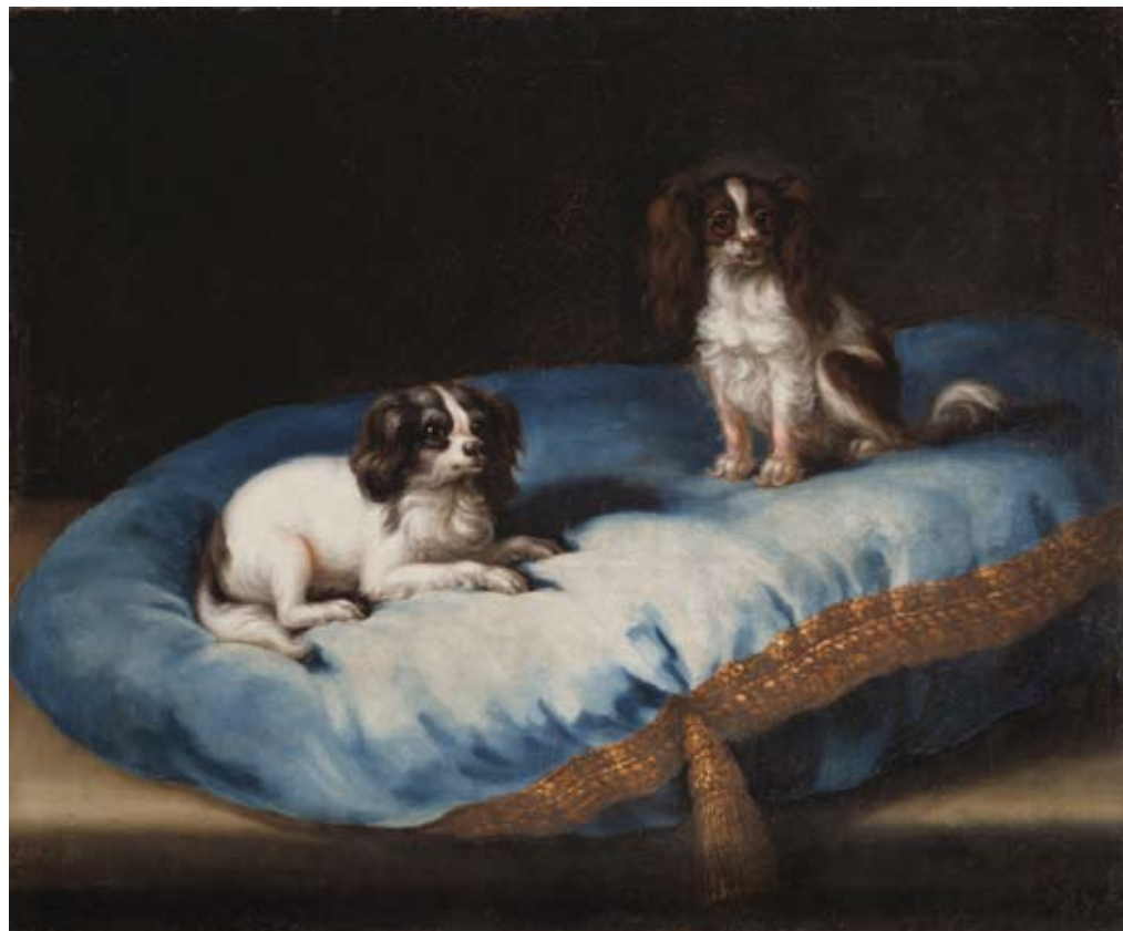
3. David Klöcker Ehrenstrahl (tillskriven), Don-Don och Nespelina.