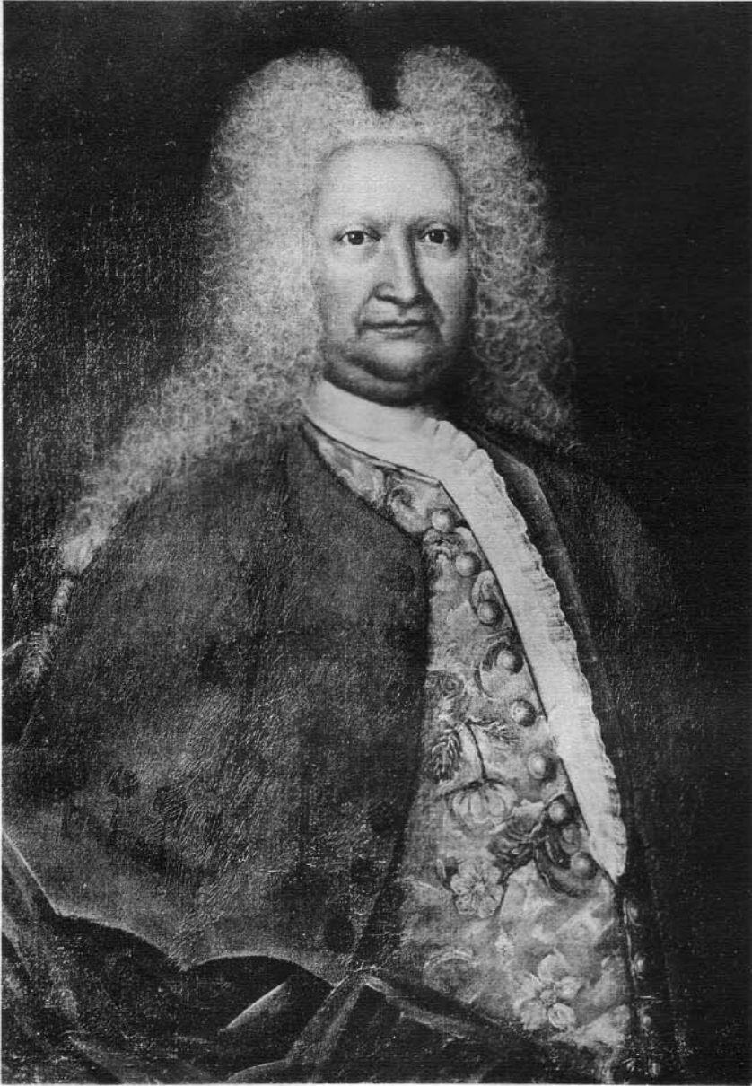
Germund Cederhielm (1661–1741), porträtt från 1734 utfört av okänd konstnär (Bjärka-Säby).