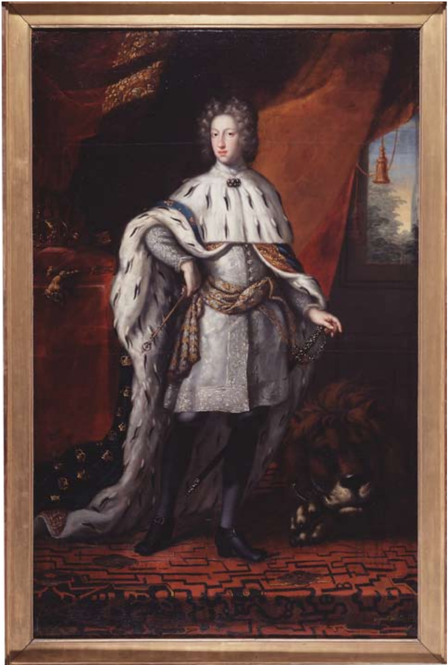
1. David Klöcker Ehrenstrahl, porträtt av Karl XII i kröningsdräkt (1697).