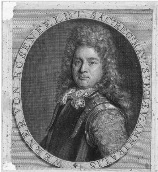
Werner von Rosenfelt som viceamiral, kopparstick troligen från 1680-talet.

Liksom hos de romerska diktarna är det frågan om en avsiktligt överdriven lovprisning. Rosenfelt berömmar papegojan för dess förtjänster och talar om den glädje som den spred omkring sig med sin sång och sina läten, och han framhåller dess unicitet – det fanns ingen papegoja som Papken (15–18):