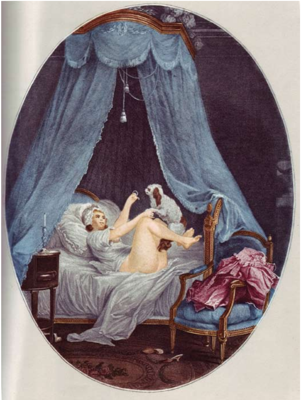
4. Jean Baptiste Chapuy (1760–1802), Le joli chien , after original av Niclas Lafrensen d.y. (1737–1807).