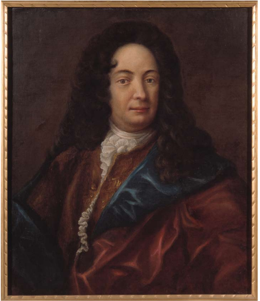
5. Ludwig Weyandt, porträtt av Olof Hermelin (1658–1709).