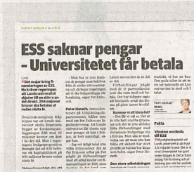
Sydsvenskan, fredag 20 september 2013.

acceptera. Men det ska inte tolkas som att vi inte haft möjlighet att få sådana avtal, men vi har en bit kvar tills vi har nått ända fram.