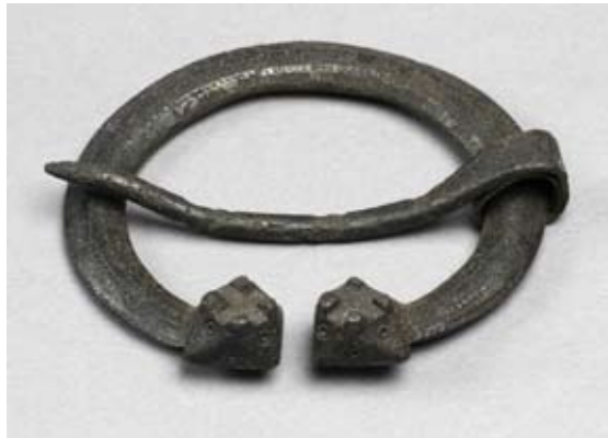
Figur 2. Ringspänne med facetterade och piggförsedda knoppar från grav 1053

intill varandra. Detta kan indikera att de gravlagda personerna tillhört samma familj, släkt eller annan typ av social gemenskap.