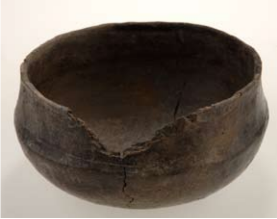
Figur 1. Keramik av östersjöfinsk typ från Birka, Bj 731.