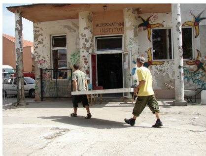
Aktivitetter.