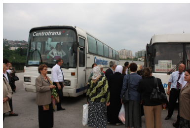
Samling. Foto: Dragan Nikolić 2010

”Var är Bećirević, Fadila Bećirević?” – ropade en av organisatörerna högt. Det var kaotiskt på platån framför Istikal Moské i stadsdelen Otoka. Moskén var en av många överväldigande sakrala byggnader som uppfördes efter kriget med hjälp av utländska donationer. Till sin storlek och sin robusta karaktär med två raketlika minareter såg den felplacerad ut i det bergiga bosniska landskapet med traditionellt små bosniska moskéer med en minaret. Fördelen var dock tillgången till en stor och allmän parkeringsplats.