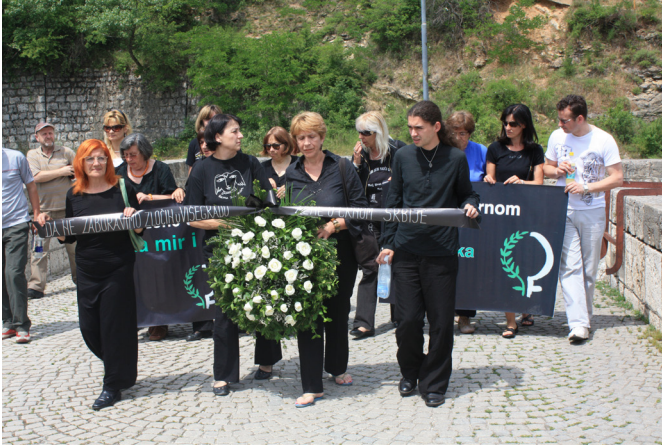
Kvinnor i Svart.

”Kvinnor i Svart” var de första som tågade in på bron. De ställde sig mot stenmuren. Stillastående höll de i en blomkrans och en banderoll där det gick att läsa följande: ”Att aldrig glömma de brott som begåtts i Višegrad, Kvinnor i Svart, Serbien” samt ”Kvinnor i Svart för fred och mänskliga rättigheter”. Inga gester, inga rörelser eller röster – slutet tystnad.