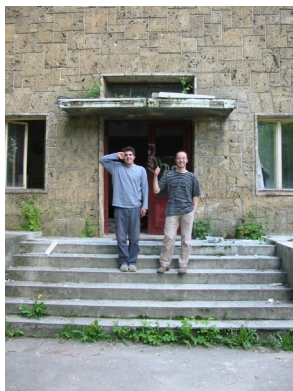
Framför det förstörda AVNOJ Museet. Sent 1990-tal.