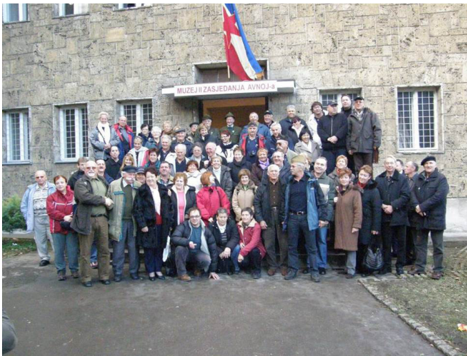
En sista bild.

AVNOJ Museet framstod i det ljuset som ett antifascistisk space of appearance där människor gick ut ur det privata och blev samhället. Men det som verkligen saknades i detta fall var just ett samhälle som fungerade enligt de idéer som kom i dagen under de många ceremonierna. I stället för att bli den process som gjorde människor till medborgare blev de till kritiker av det existerande politiska systemet. AVNOJ Museet blev på det viset en plats där minnet och den stora berättelsen om Titos Jugoslavien aktualiseras som fiktion. Men hade det också potentialer för en repolitisering?