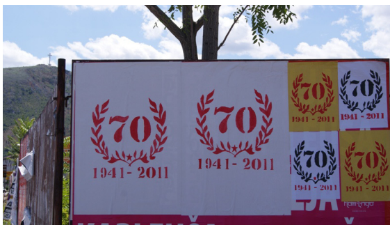
70-år av upproret mot fascismen i BiH. Foto: Dragan Nikolić 2011

Anledningen till att de sydde egna banderoller, målade och för hand gjorde affischerna, sublimerades till en enkel hyllning till alla de människor i landet som 1941 stod upp emot fascistiskt förtryck. Idag är de medvetna om att ”varje revolution bär på fröet av egen förstörelse”, som den erfarna Antifa-aktivisten Boro, en skarp och mycket kritisk man i 35-årsåldern uttryckte det, genom att dra paralleller till den historiska antifascismen i BiH och Jugoslavien.