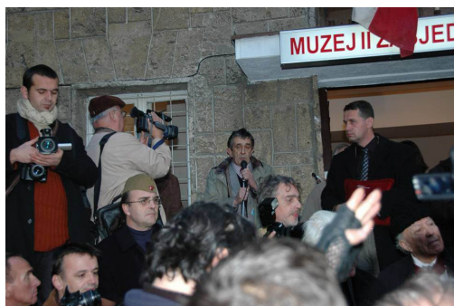
Inför återinvigningen av AVNOJ Museet.