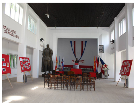
Museet som ett sjukhus.

I Visby kunde man njuta av en mer avspänd relation till de personliga minnena. Ingen som kom ihåg sin barndoms värld och det politiska system som rådde då, riskerade att ställas utanför gemenskapen. Man hade heller inga grupper som i raseri gav sig på att förstöra byggnader för att därmed utplåna ovälkomna minnen. Ibland kan de lieux de mémoire som Pierre Nora skriver om vara stående provokationer, och så förhöll det sig med AVNOJ Museet.