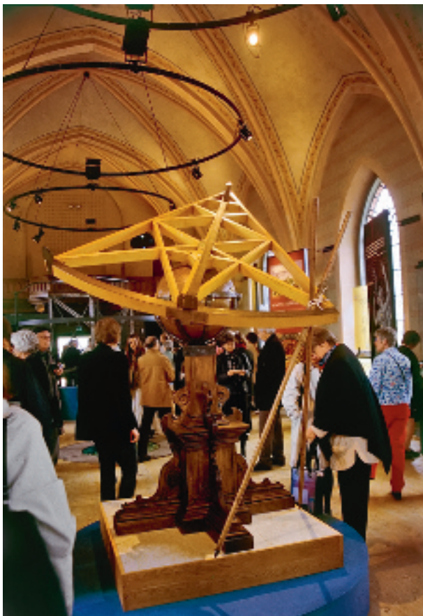
| FIG. 6 | Vens nye kirke forvandlet til Tycho Brahe museum. april 2005.

hovedstad Tallinn blev Skt. Nicolai således anvendt som kunstmuseum og koncertlokale, Skt. Olais høje tårn blev anvendt til KGB's antenner, dominikanerkirken som garage og den svenske kirke som sportsklub.