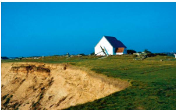
| FIG. 1-2 | Mårup middelalderkirke på klinten i Nordjylland. Foto øverst: Hans Hunderup, Hunderup Luftfoto i Hjørring, marts 1998. Foto nederst: Jes Wienberg, juli 2006.