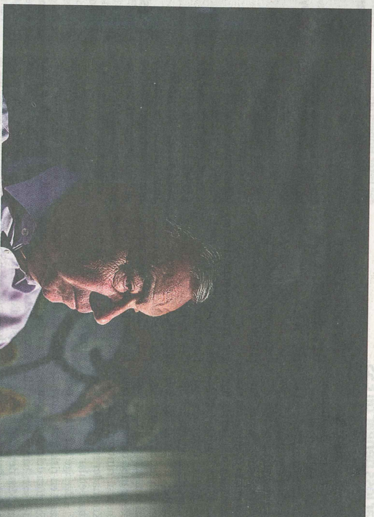
Ett tiotal resor ut i Europa har han gjort för att synhopp ESS-avtal.

nas långt mindre än 30 procent för finansieringen, säger han.