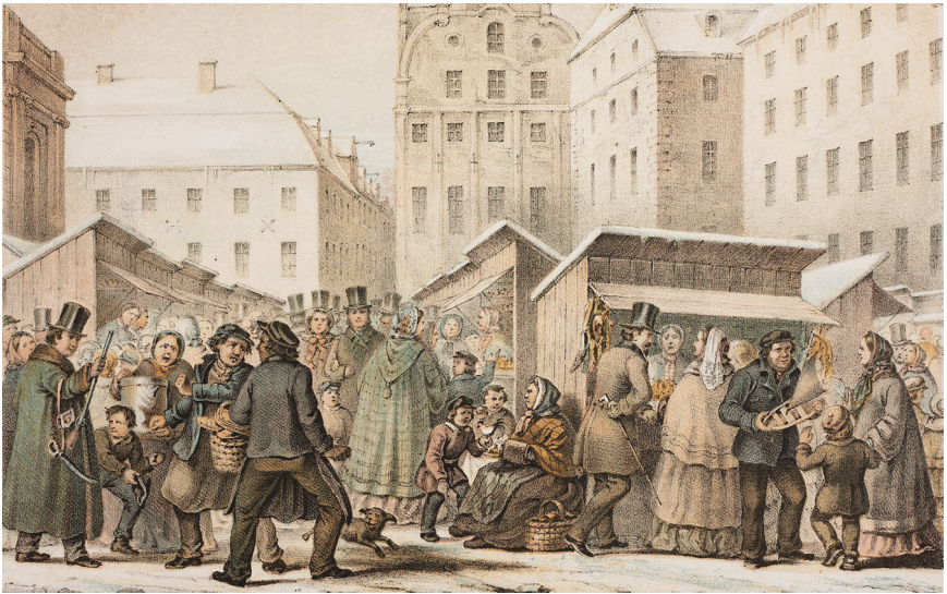
Julmarknaden på Stortorget i Stockholm, ur Litografiskt Allebanda , 1859.

läsning och läsningens dåliga respektive goda värden som pågick i samtiden. Där möttes motsatserna manligt–kvinnligt, mödosamt–lustfyllt, beständigt–flyktigt, lärande–underhållande och, sist men inte minst litterär–bildande kontra fiktion–populär. 27