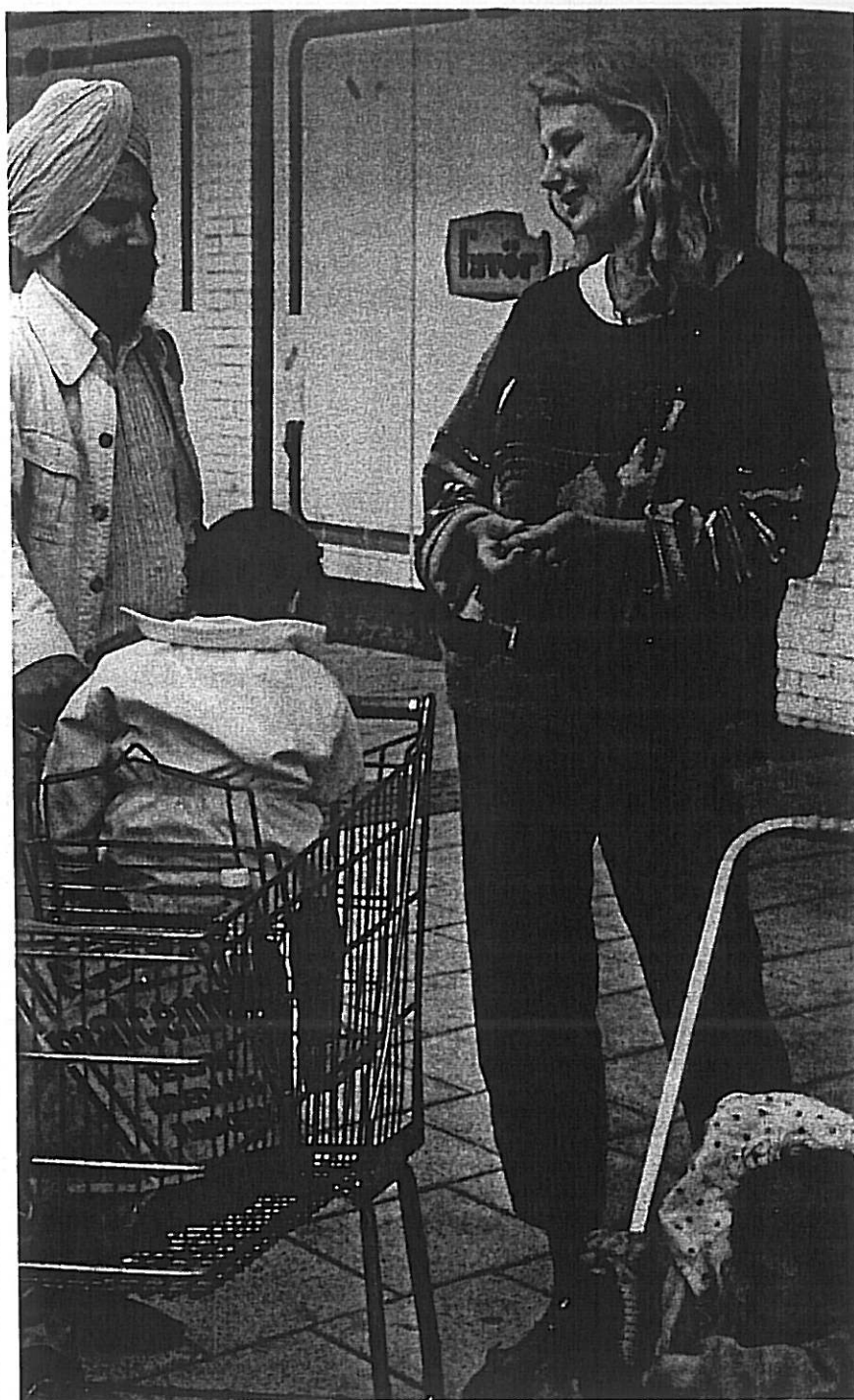
Att samtala är extra viktigt i ett område där människor från många olika kulturer bor.

Ibland kan det i vardagslivet uppstå konflikter som saknar all ekonomisk eller politisk anknytning. Dessa konflikter är produkter av mellanmännskli-