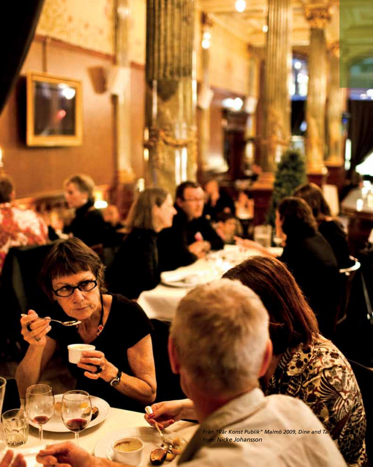
Från "Vår Konst Publik" Malmö 2009, Dine and Talk