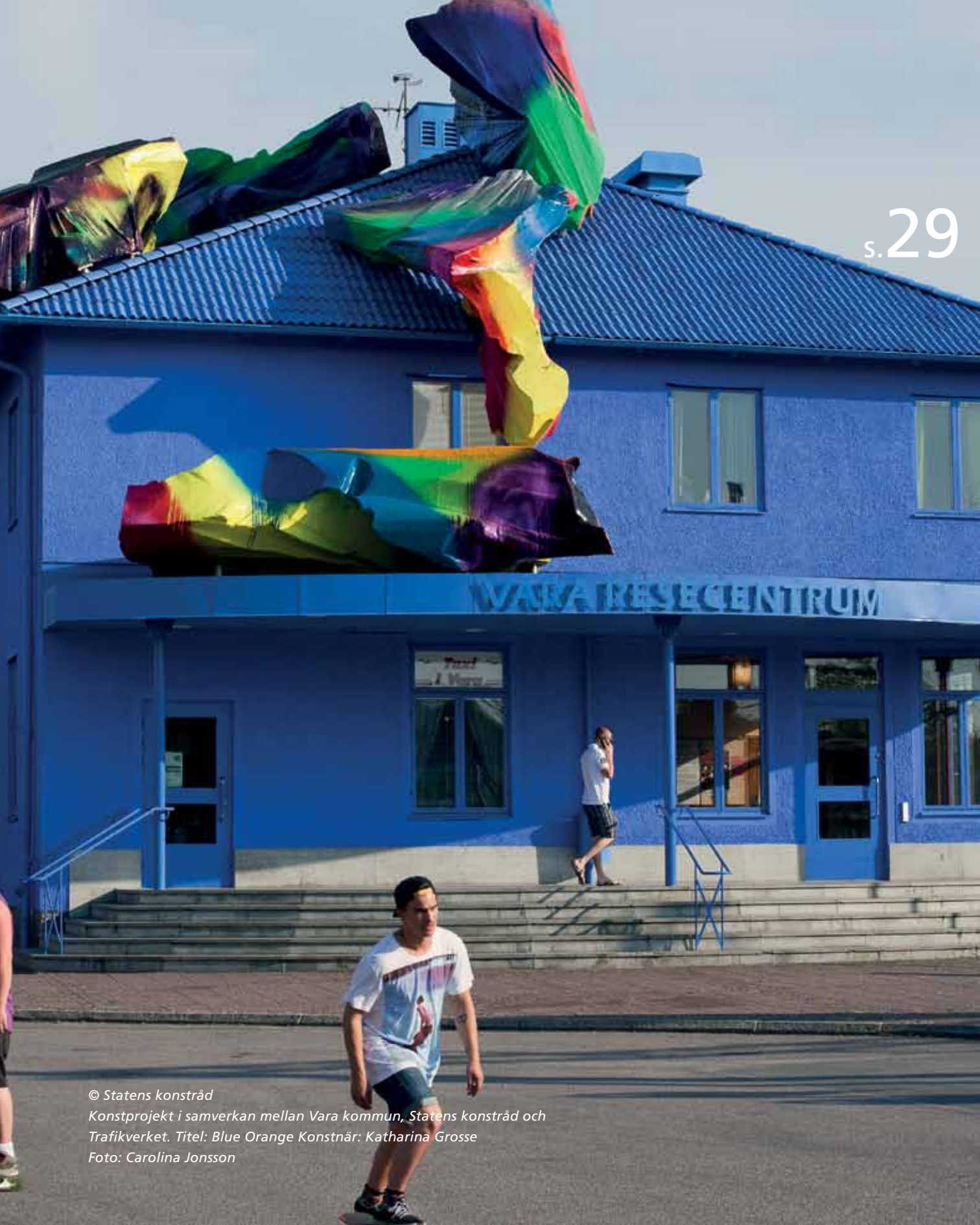
© Statens konstråd Konstprojekt i samverkan mellan Vara kommun, Statens konstråd och Trafikverket. Titel: Blue Orange Konstnär: Katharina Grosse Foto: Carolina Jonsson