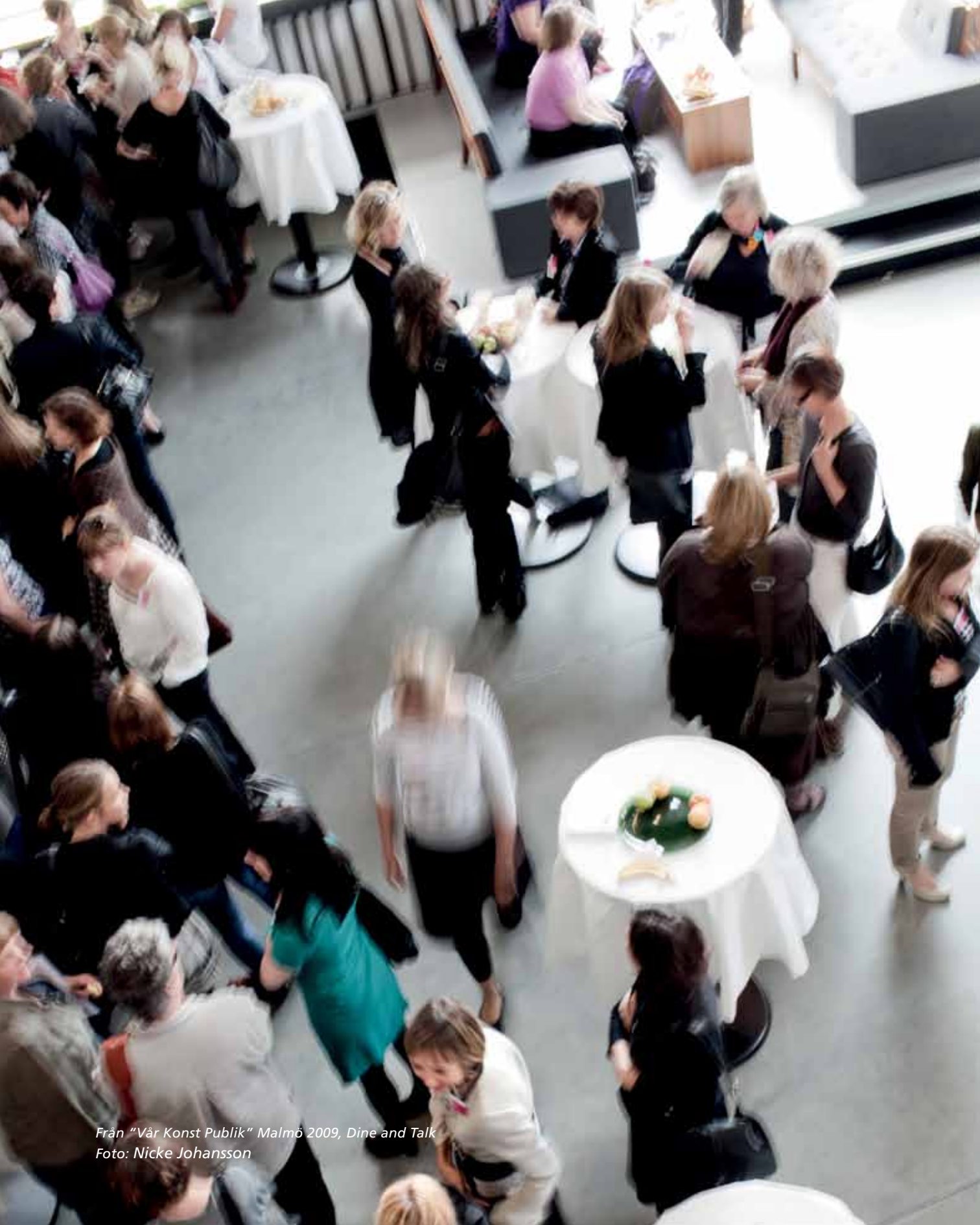
Från "Vår Konst Publik" Malmö 2009, Dine and Talk