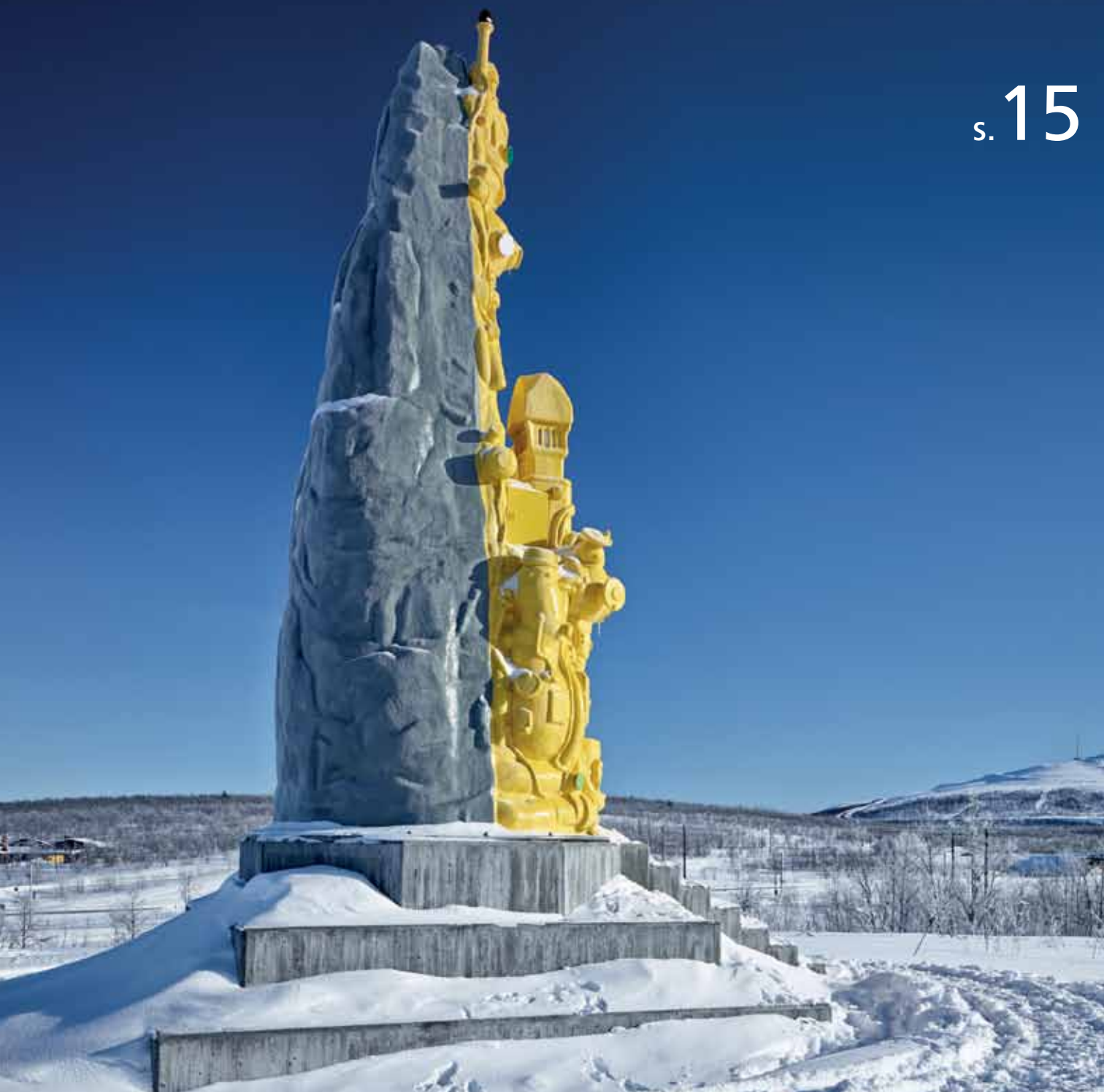
Oskar Aglert, "Totem", 2012. Skulptural, konstnärlig gestaltning, Ädnamvaare i Kiruna. Statens konstråds projektledare, Peter Lundström. © Oskar Aglert/BUS 2013