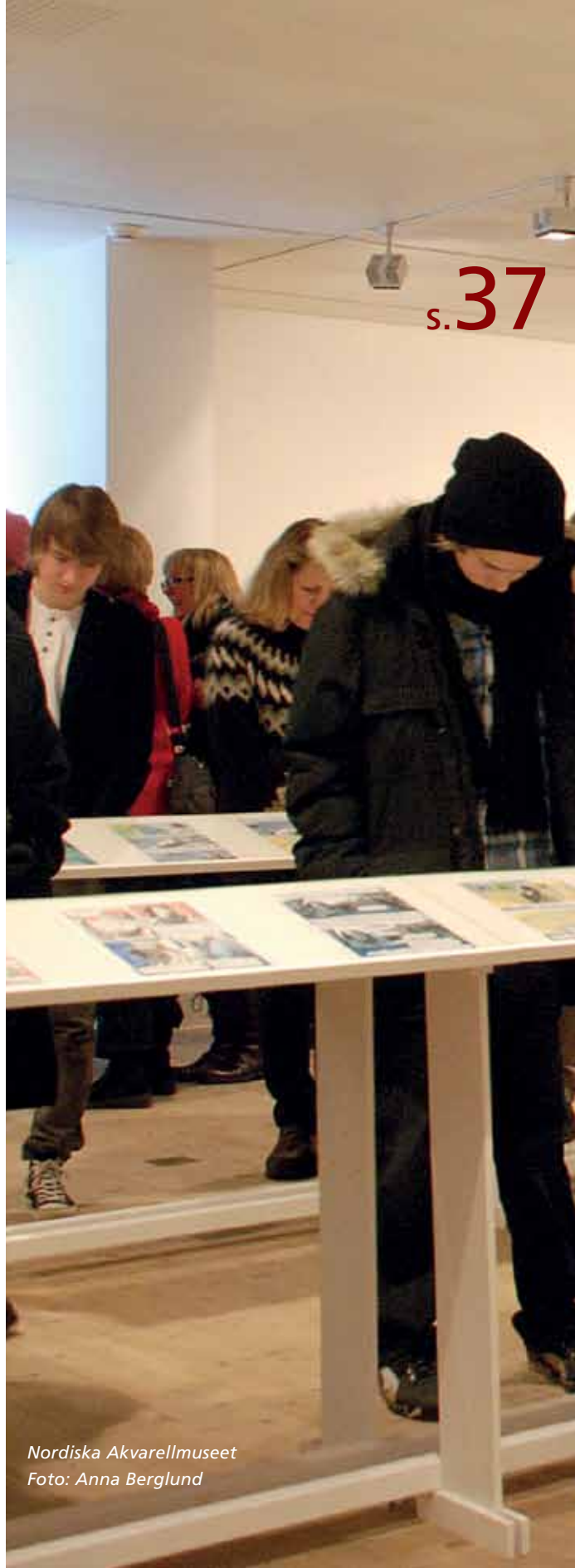
Nordiska Akvarellmuseet

Att gå utanför det redan beprövade kräver mod och mod kräver självförtroende och trygghet inom organisationen. Det måste finnas en balansgång mellan de anställdas visioner, kunskap och passion för verksamheten och en nyfikenhet att möta och lyssna på människor från andra fält än konst- och museivärlden. Att aktivt söka oväntade möten och nya samarbeten.