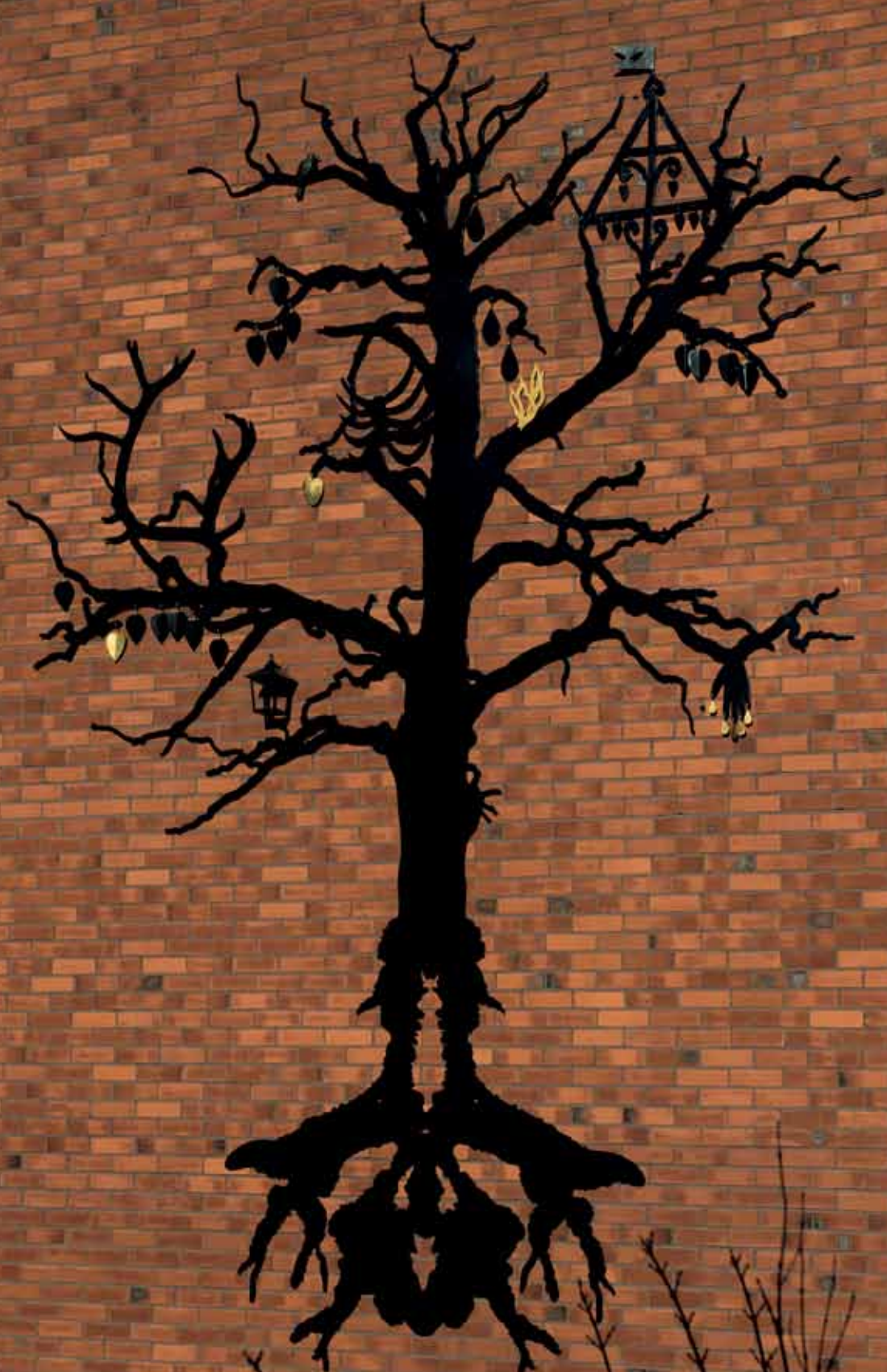
Tilda Lovell, "The other tree", 2012. Skulptural gestaltning på fasad, för Dans och cirkushögskolan i Stockholm Statens konstråds projektledare, Monika Larsen Dennis. © Tilda Lovell/BUS 2014