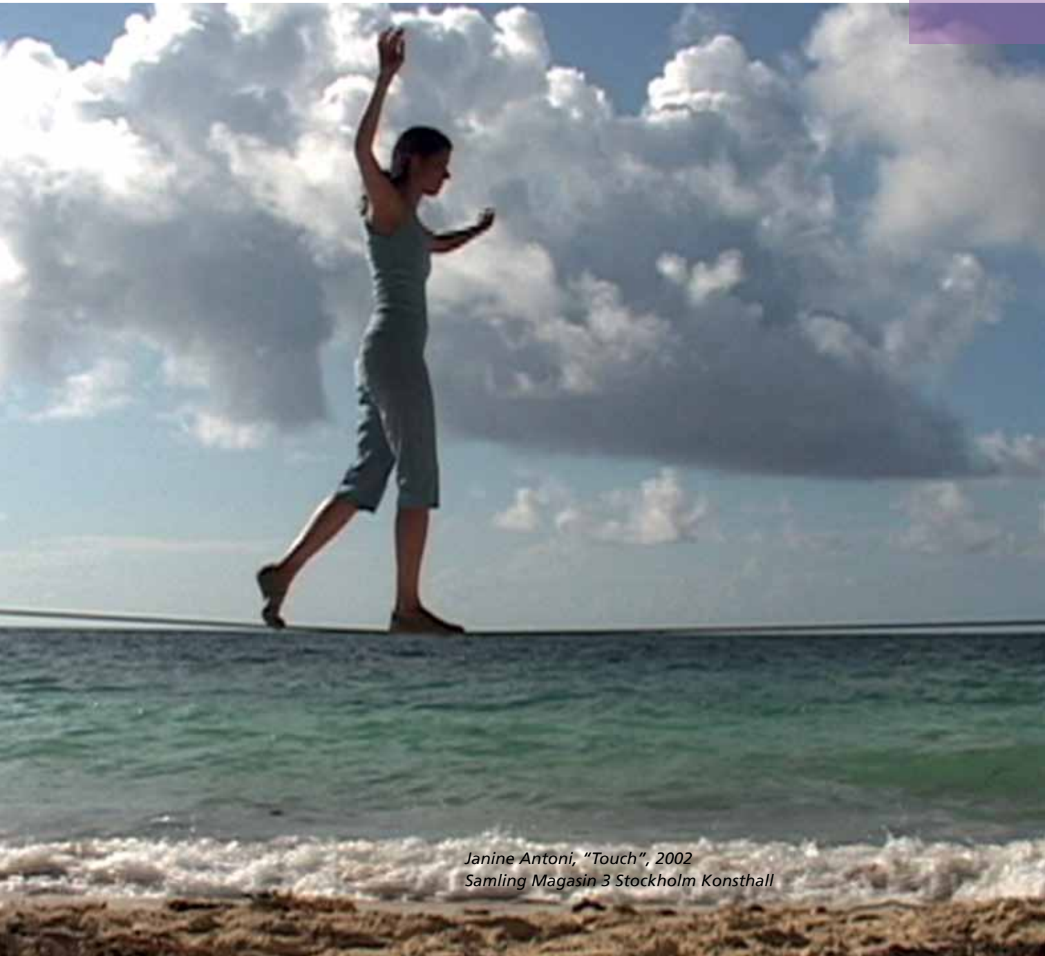
Janine Antoni, "Touch", 2002 Samling Magasin 3 Stockholm Konsthall