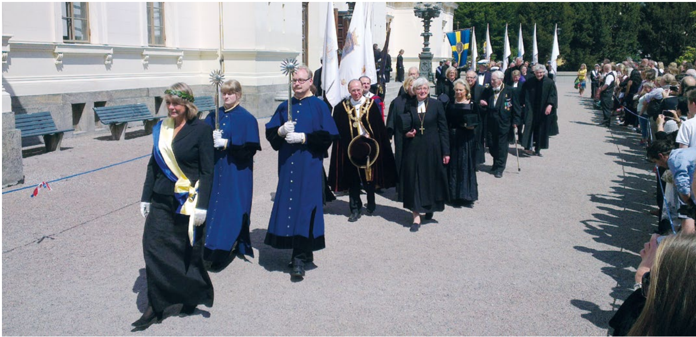
På detta foto från processionen vid doktorspromotionen 2013 ses såväl de moderna pedellkåpor som den nuvarande rektorsdräkten och, i de bakre leden, ett antal av de 1959 införda talarerna.

demiska ceremonierna – som exempelvis representanter för universitetets förvaltning – finns dock även en "allmän" variant vars krage inte pryds av någon specifik fakultets signum utan av de generella svenska färgerna blått och gult. 19