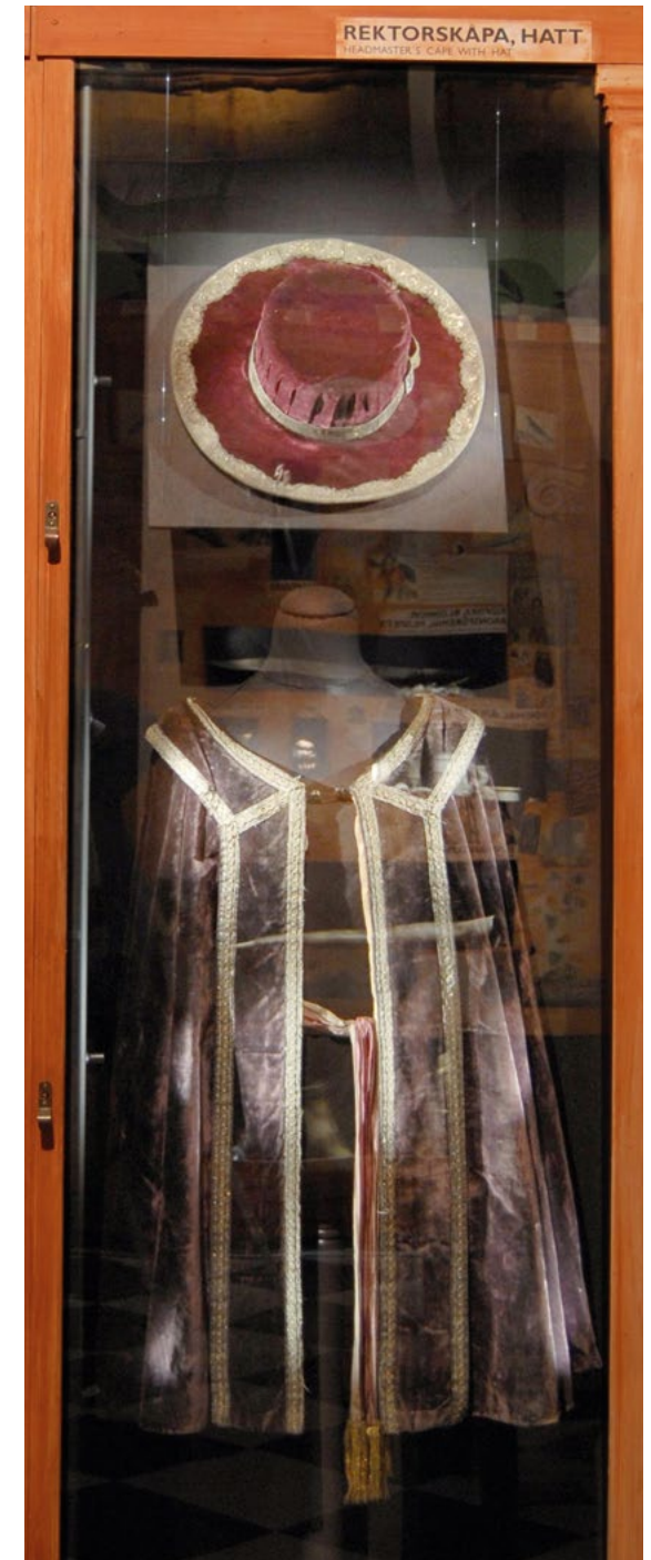
1768 års rektorskåpa i sin nuvarande monter på Historiska museet. Hatten är däremot från 1800-talet.

När universitetet 1767-1768 beredde sig att celebrera sin första "sekelgammal" konstaterade professorerna att de då sekelgamla rektorspersedlarna var "genom tiden och bruk så förnötta, att de på intet sätt skulle kunna vid detta tillfälle brukas". 27 Av Statskontoret hade man dock fått 800 daler silvermynt för särskilda kostnader "för wid Jubilæum förefallande behof" och dessa kom nästan uteslutande att användas till förfärdigandet av en ny rektorsdräkt. 28 Totalt 336 daler lades på inköp av purpurfärgad sammet samt gult och vitt taftsiden från handlaren Lars Schenmark i Landskrona. Härtill kom lokalt vävda guldband för 116 daler samt spännen till kappa och hatt för 104 – därtill prydda med bergskristaller för 250 (dock nedprutade från 270)! Till detta kan även läggas personalkostnader: skraddare Gierdz fick 44 daler för sitt sömnadsarbete, hattmakare Mathiasson 4 daler för hattstommen och pedellen Thåström 3 daler för sina resekostnader då han for till Landskrona och hämtade