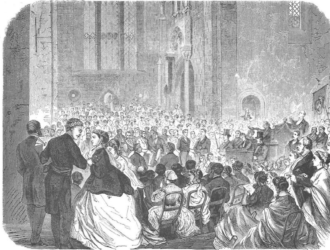
Träsnitt ur Ny illustrerad tidning från filosofiska fakultetens promotion vid universitetsjubileet 1868. Notera att mannen till vänster i förgrunden bär midjeskärp till sin frack – en rest från 1700-talets nationella dräkt. Till höger om bildens mitt ses bland annat pedellerna, vid denna tid iförda frack och hög hatt, med universitetets spiror.

historieskrivning är korrekt innebär det rimligen att den röda färgen ursprungligen inte varit en fakultetsspecifik markör för filosoferna utan blivit detta först sedan de andra fakulteterna anlagt marskalksband i andra kulörer. Ytterligare en detalj som särskilt kan (men inte måste) utmärka den akademiska fracken är doktorskragen. Denna innebär att det ordinarie bakre stycket av frackrockens krage byts mot ett nytt stycke i sammet, broderat med olika lärdomssymboler, allt i svart. Olika lärosäten har olika varianter av dessa kragar, men däremot är det mer sällan så att de faktiskt skiljer mellan fakulteterna inom ett och samma lärosäte, även om detta nog är en rätt vanlig missuppfattning. För Lunds universitets del fanns fram