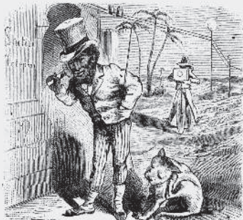
4) och derifrån till Afrika kommer man i en handvändning. I farten afbildar han med sin optisk-mekaniska skizzeringsapparat en ökenman, som just håller på att föra ett telefonsamtal med en affärsvän.