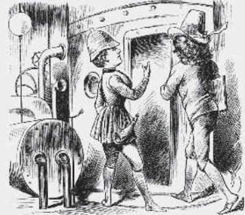
3) Resan till exempel härifrån till Australien göres mycket hastigt med dynamitbanan genom den underjordiska tunnelen. Man är i Sydney på två och en half timme.