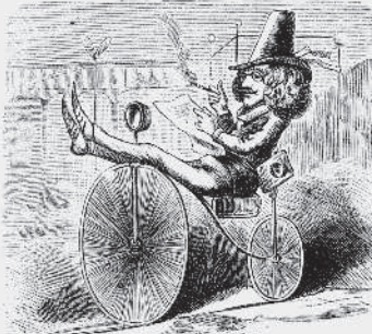
1) Ja, om femtio år skall man få det riktigt bra, då sätter sig till exempel en sådan der målare helt lugnt upp på sin elektriska velociped och kör.