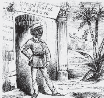
5) Han öfvernattar i det stora, med all önskelig komfort utstyrd Saharahotellet.