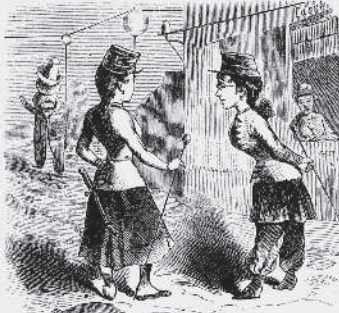
2) Utan att blifva hejdad af tullverket, som, tack vare kvinnömmancipationen, nu representeras af damer, på den wonside landsvägen ut i vida världen.