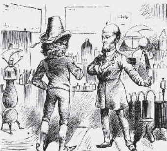
7) I Amerika besöker han en af de mycket stora konstmatvarufabrikerna, köper några flaskor kött- och grönsakspiller och reser till Nordpolen.