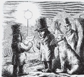
8) Hvarst han ser eskimåerna, som redan läsa sina tidningar vid elektriskt ljus och värma sig vid patenterade nordpols-varmluftsugnar. Derpå får han ändtligen hem, målar hvad han vill.