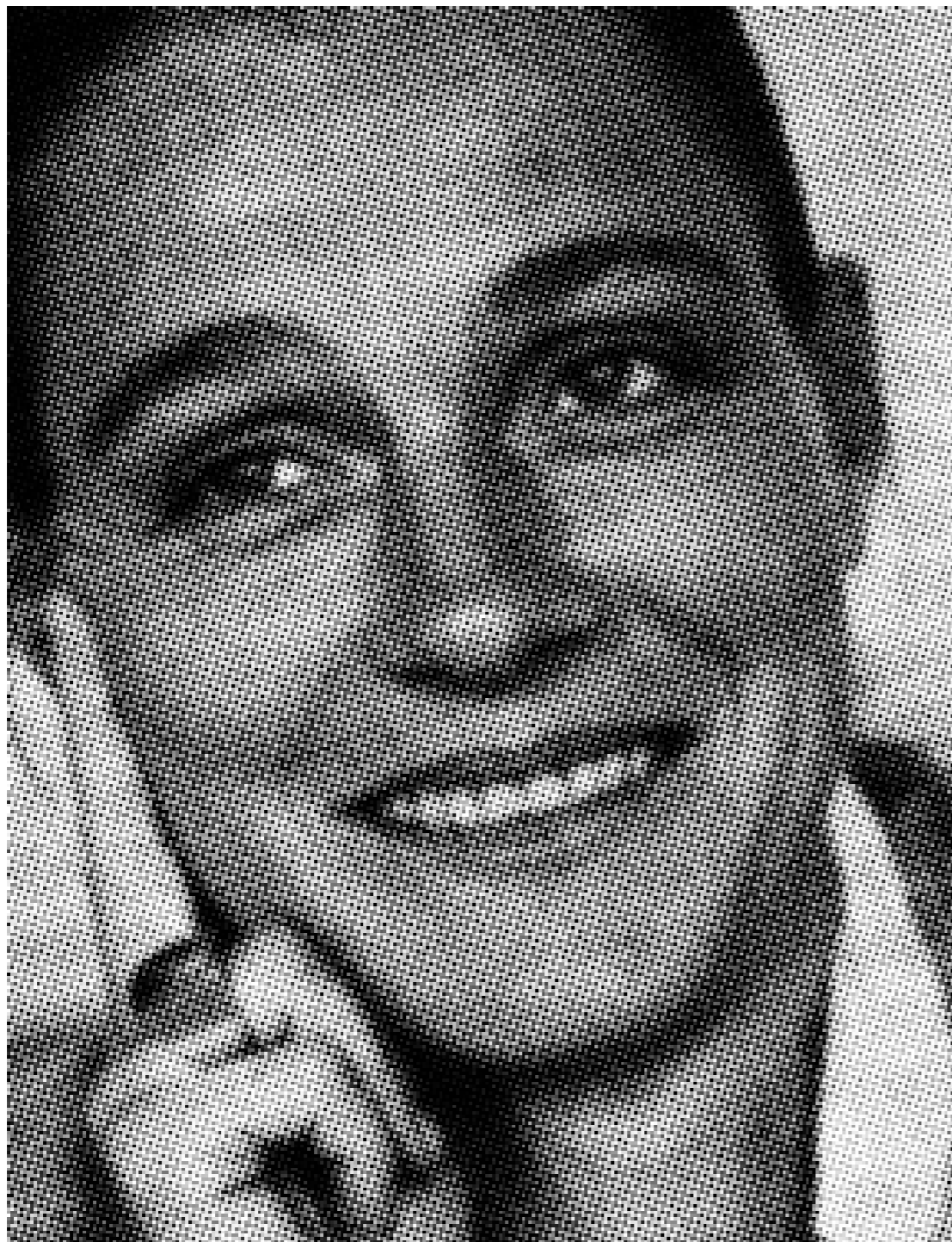
Ritt Bjerregaard (1941-) Tidl. undervisningsminister 1973 og 1975-78