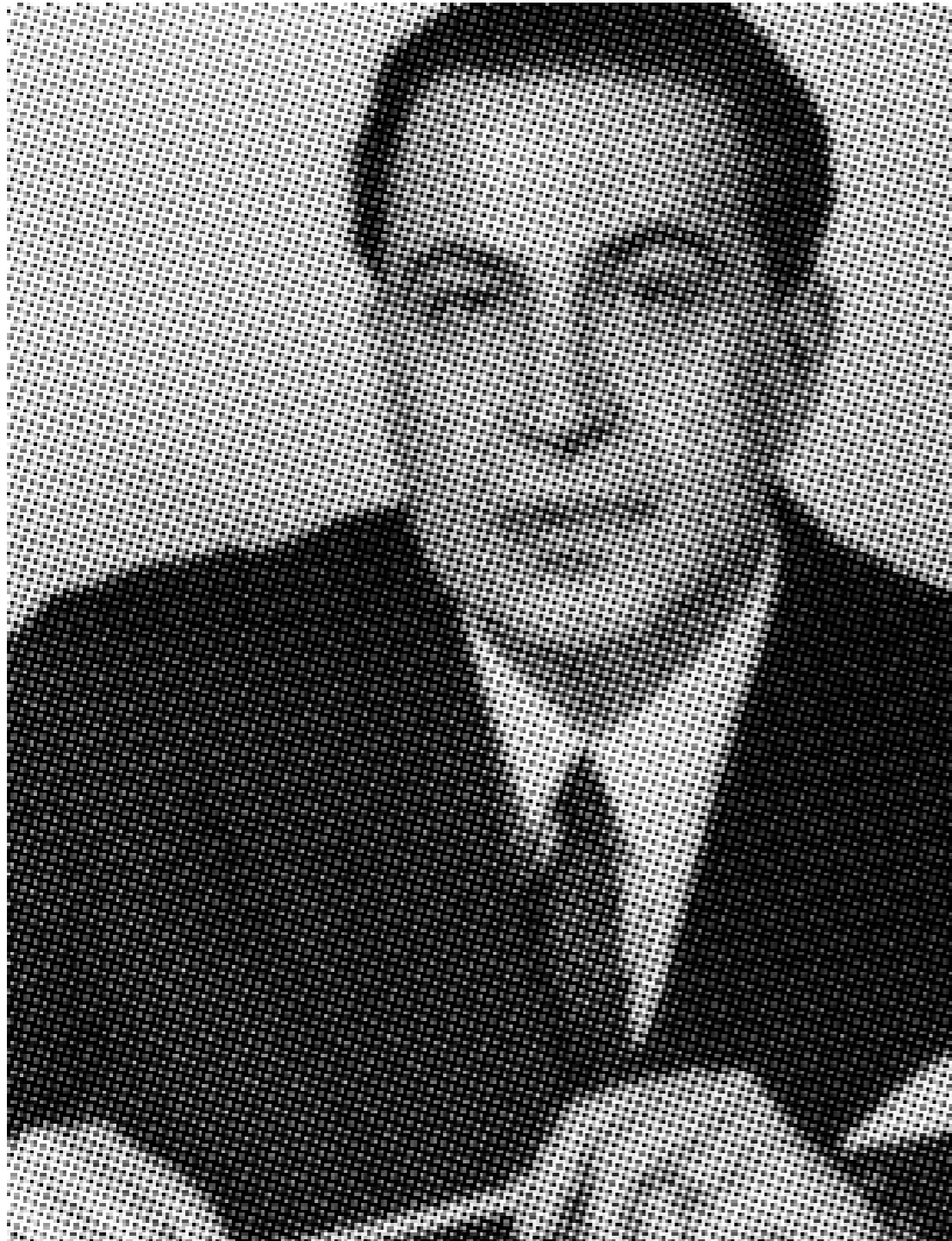
Jaime Torres Bodet (1902-74) UNESCO-generaldirektør 1948-1952

og Kvinderne. Selv om kvindeaspektet ikke optog den brede politiske debat i Danmark, havde den danske delegation til FNs generalkonference i New York i efteråret 1946 væsentlig indflydelse på området ved fremsættelsen af et resolutionsforslag