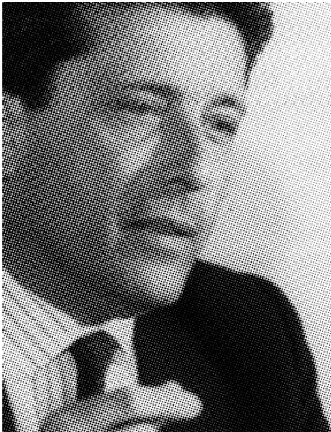
Federico Mayor (1934-) UNESCO-generaldirektør 1987-1999

men er en problematik, der gælder alle mennesker hele livet. Artikel 28 i CRC tager uddannelsesaspektet op og pointerer, at grunduddannelse skal være gratis og en forpligtelse for alle børn. CRC er ratificeret af alle regeringer i verden med undtagelse af USA og Somalia. 277 Med de to konventioner fortsatte FN og UNESCO det brede arbejde inden for uddannelsesområdet. Det kønspolitiske aspekt var nærværende, uanset om det handlede om børn eller teknisk-faglige uddannelser og det må på mange måder siges at være i tråd med mainstreaming-strategien.