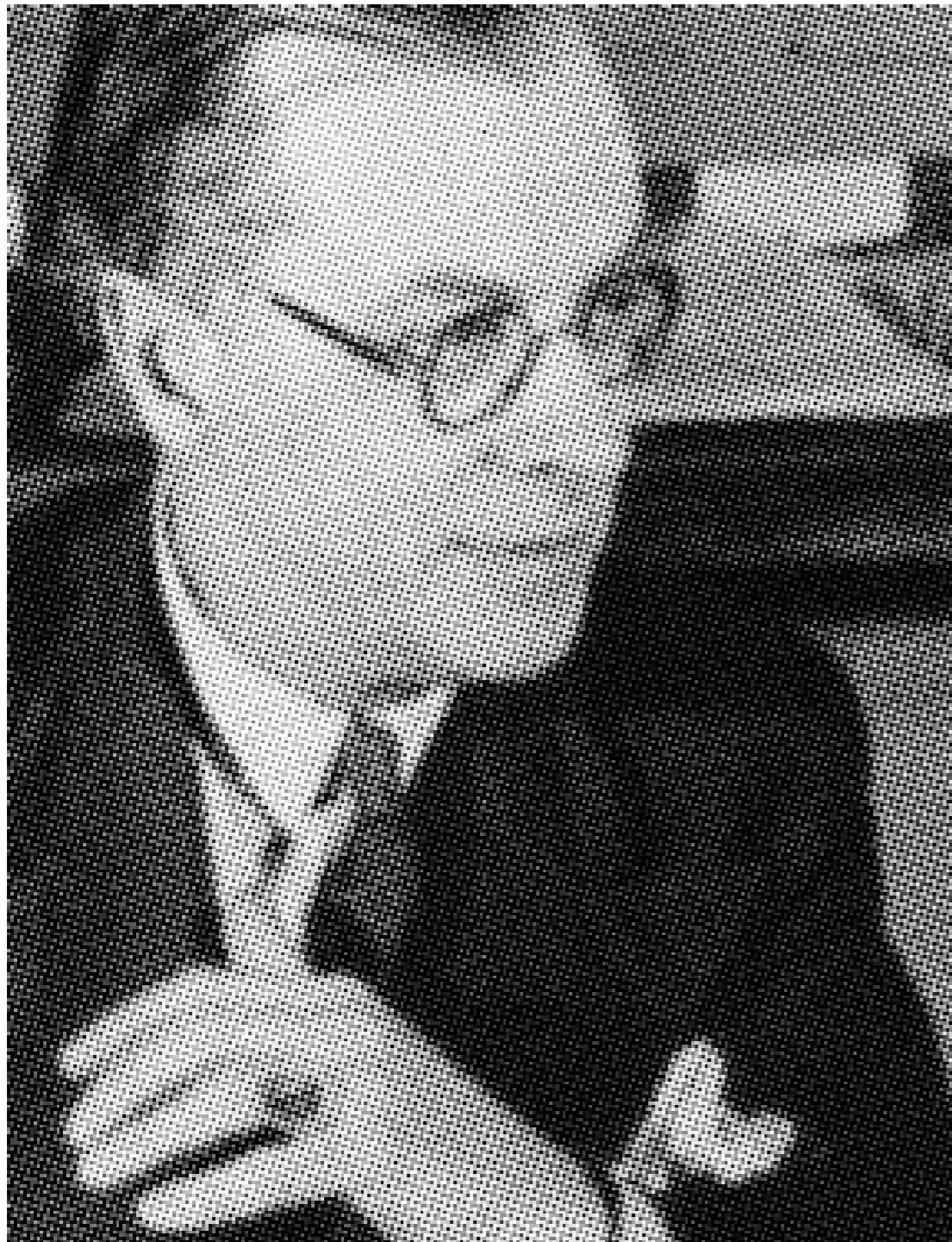
Julian Huxley (1887-1975) UNESCO-generaldirektør 1946-1948

for børne- og ældreomsorgen i takt med, at kvindernes uddannelses- og erhvervsfrekvens var stadig stigende. Den traditionelle familiestruktur og forholdet mellem kønnene var i hastig forandring. 55 UNESCO var sammen med det øvrige FN-system, og senere også EF, med til at sætte nye standarder for blandt andet kvinders udfoldelse i samfundet. Det var med til at påvirke kønspolitikken nationalt som internationalt. Den danske UNESCO-nationalkommission var på forskellig vis en af de kanaler, hvorfra der kom kvindepolitiske input til og fra Danmark både via dens skiftende medlemmer og via dens funktion som kommunikationsled mellem UNESCO og de danske politikere.