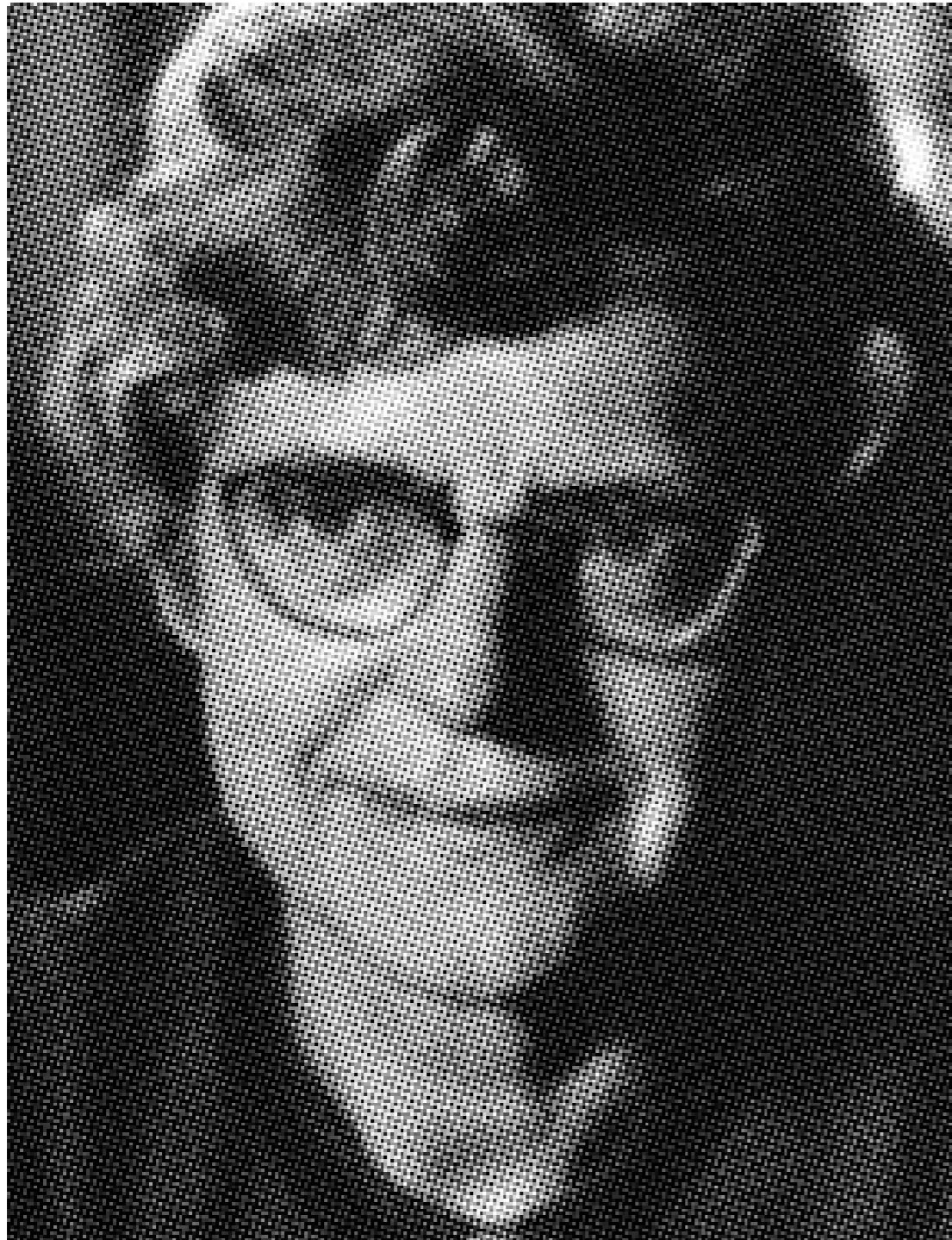
Bodil Koch (1903-72) Tidl. kirkeminister)

I grove træk vidner programmerklæringerne imidlertid om en udvikling, hvor opmærksomheden øges år for år; et fokus der har ført til udvidelser og efterhånden mere og mere specifikke definitioner af de kønsproblematikker, som eksisterer inden for uddannelsesområdet.