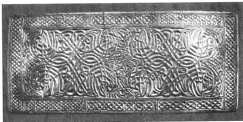
Fig. 2. Var finns djuren? 4 Bronsspännet från Skabersjö, Skåne. Spännet är 13x6 cm stort. (Foto: Bengt Almgren, Lunds Universitets Historiska Museum).

var sannolikt mycket attraktivt just på grund av sin exklusivitet, antagligen såväl före som efter det att någon ristat runor på baksidan.