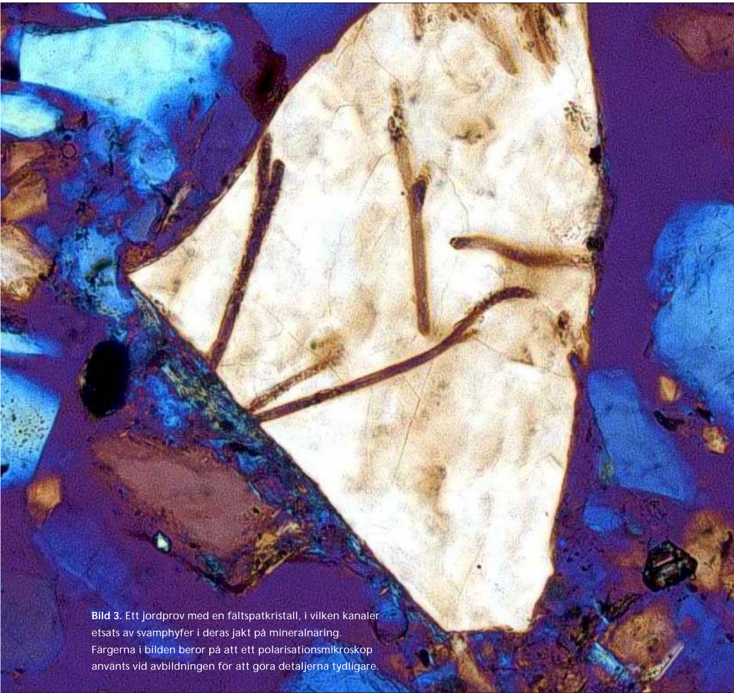
Bild 3. Ett jordprov med en fältspatkristall, i vilken kanaler etsats av svamphyfer i deras jakt på mineralnäring. Färgerna i bilden beror på att ett polarisationsmikroskop använts vid avbildningen för att göra detaljerna tydligare.