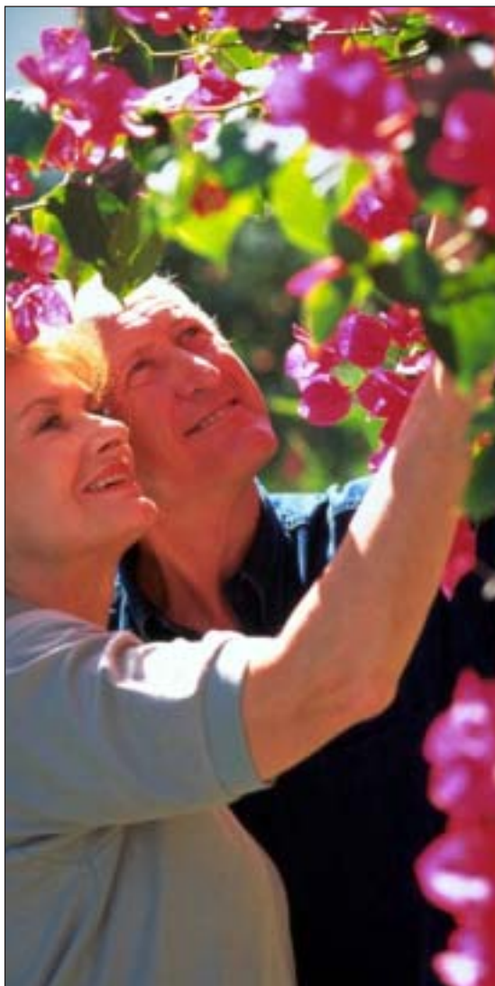
Bild 4. Även den moderna människan vill omge sig med trädgårdar och växter.

kunnat belägga ägde rum redan under devontiden för ungefär 360 miljoner år sedan.