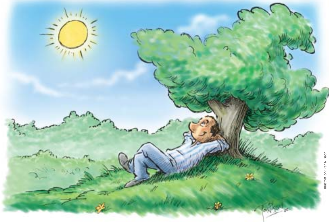
Illustration: Per Nilsson.

Jag ligger under trädet, mitt på dagen. Mot marken har jag ryggen, och mot himlen magen. Det är så stilla – grönskan är ju stum, men i det tysta, i det lilla, äger det ett under rum.