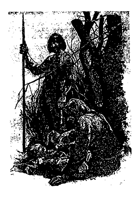
Fig. 3: Stenåldersfamiljen anno 1970 (efter Brinch-Petersen 1980)

Hundra år senare har inte bilden ändrats på något radikalt sätt (fig. 3). Bilden från 1970-talet visar samma komposition som 100 år tidigare. Men mannen tittar nu ner på kvinnan och barnet. Som en följd av ökad kunskap bär den modernare familjen sydda skinnkläder och inte pålsar.