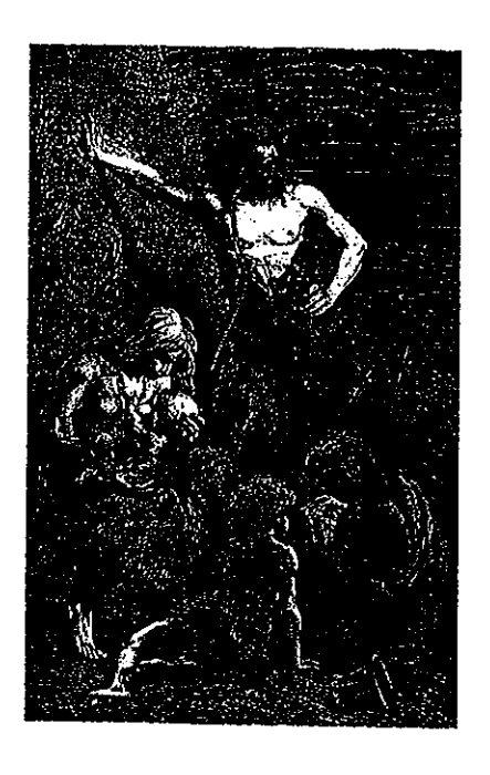
Fig. 2: Stenåldersfamiljen anno 1870 (efter Figuier 1870)

Ett annat tema som följer och som jag lägger fram på likartat sätt som föregående tema handlar om familjebildningar. Efter inledande diskussioner kring föreställningar om familjer hämtade från studenternas egna erfarenheter visar jag en gravyr av en stenåldersfamilj som är gjord på 1860-talet (fig. 2). Familjen består av pappa, mamma och tre barn. Mannen står upp och lutar sig mot en klippa, han spanar långt bort i fjärran – vad tänker han på? Kvinnan ägnar sig åt barnen. Hon sitter ned och ammar minstingen. Kvinnan och barnen är lägre placerade i kompositionen och bildar en egen enhet.