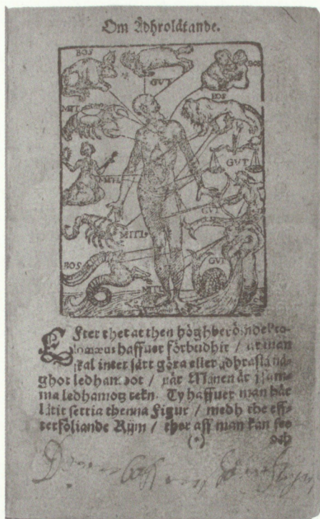
Fig. 4. Den så kallade zodiakmannen, som visade hur himlakropparna stod i förbindelse med enskilda kroppsgorgan och rådde över människans hälsa, var en av tidevarvets mest välbekanta bilder. Här återgiven ur 1622 års svenska psalmbok.

ler som den danske biskopen Peder Palladius skrev i samband med pesten 1553: »Saa slaar Gud vore Børn for vore Øjne, at vi gamle [syndare] [...] skulle forskraekkes deraf og rette os« – »vore uskyldige Børn er taget af Dage for vor Skyld«. 33