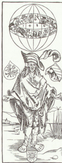
Fig. 6. Uppkomsten av syfilis ansågs av många lärde stå i ett samband med den konjunktion som infallit 1484. På Albrecht Dürers bekanta träsnitt står den syfilisdrabbade under en symbolisk bild av zodiaken. Bilden spreds ursprungligen som flygblad med text av den tyske läkaren Theodericus Ulsenius då farsoten började grassera i det tysk-romerska riket 1496.

Skräcken för illavarslande tecken i skyn kom att genomsyra en stor del av tidevarvets lärda litteratur. En-