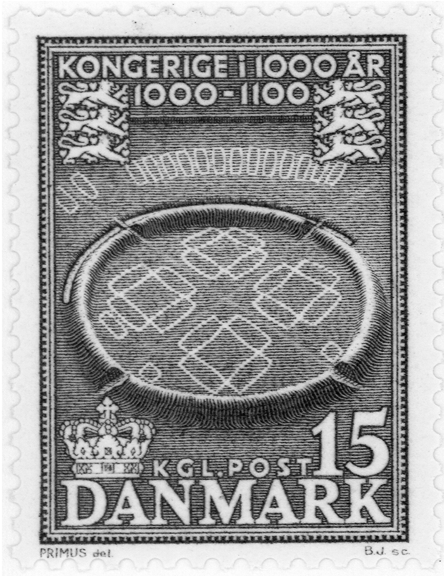
Figur 3. Dansk frimärke som avbildar trelleborgen Trelleborg vid danska Slagelse och som framhäver Danmarks långa kontinuitet som kungarike.