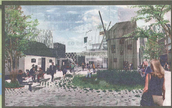
Science Village. En tanke är att bevara delar av den gamla bebyggelsen, bland annat en mölla. Stadsdelen ska växa fram kring hållplatsen. Att ta sig till Lunds C med spårvagn ska gå på 14 minuter. ILLUSTRATION: COBE