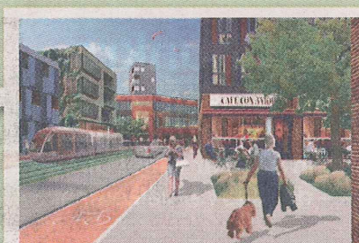
Brunnshög C. Mitt i området ligger en cirkelformad park. 2030 förväntas 12 000–18 000 människor bo och verka i stadsdelen. ILLUSTRATION: KONTORET ARKITEKTER