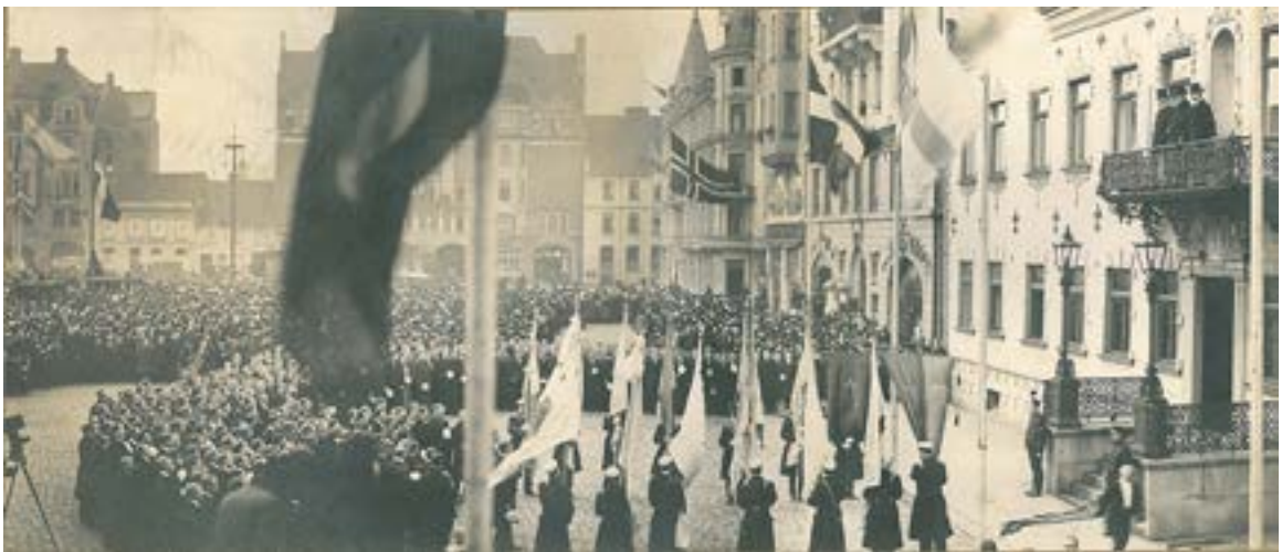
Lunds studenters uppvaktning vid trekungamötet i Malmö den 18 december 1914.

Hösten samma år måste Hungerland på något sätt ha fått vetskap om att lektoratet i tyska vid Lunds universitet höll på att bli ledigt. Redan på det sammanträde vid vilket Filosofiska fakultetens humanistiska sektion beviljade avsked åt postens tidigare innehavare, lektor Freund, noterades också en ”insänd skrivelse” från Hungerland om att få ”komma i åtanke” vid tjänsten återbesättande. 11 Som skrivelsen åtföljdes av ett välvilligt intyg från två professorer i