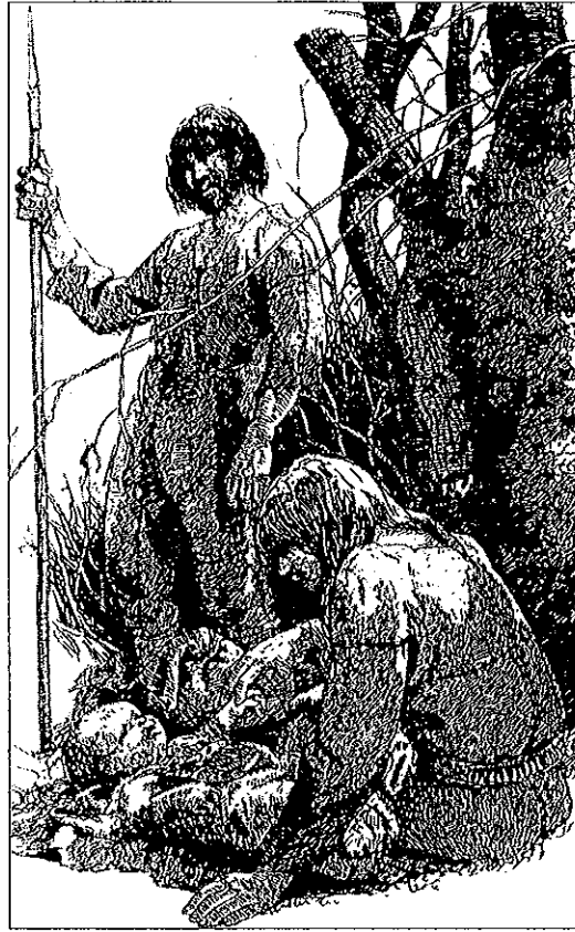
Fig. 4. Kärnfamiljen 1980 (Brinch-Petersen 1980).

kläder är inte denna familj pälsklädd utan bär sydda skinnkläder.