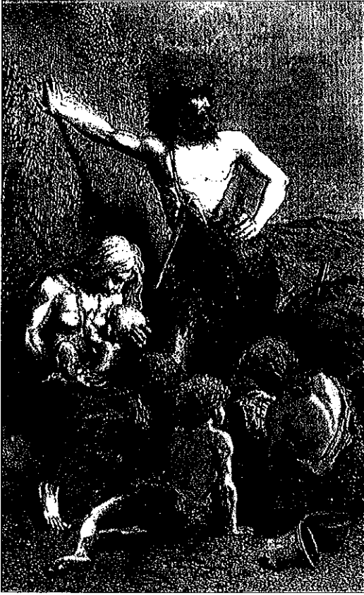
Fig. 3. Kärnfamiljen 1870 (Figuier 1870).