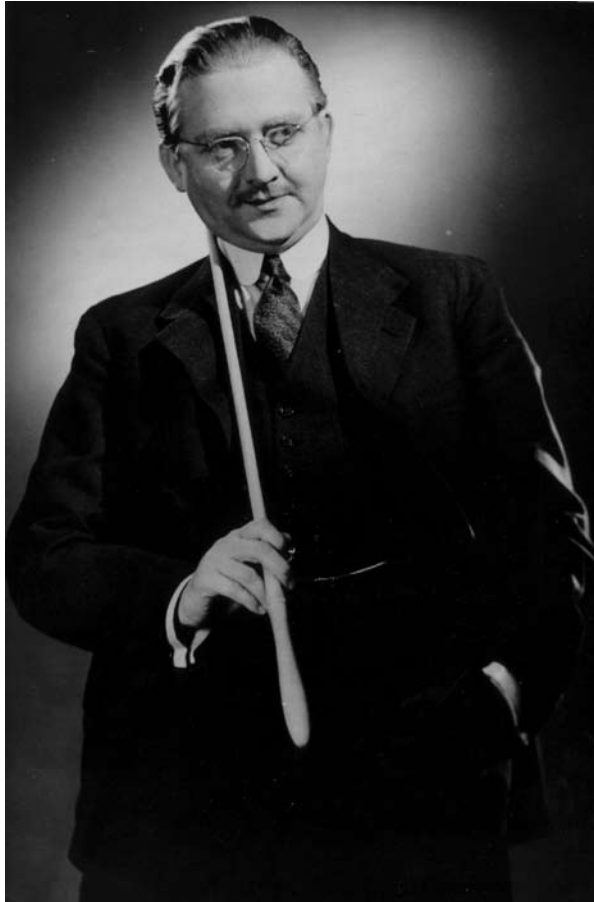
Stig Järrel som den sadistiske latinläraren i Hets från 1944.