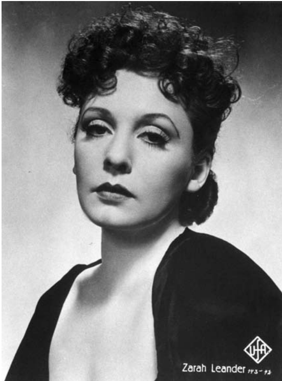
Zarah Leander (1907-1981).