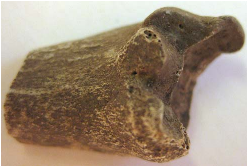
Fig. 2. Distal del av ett skenben från får/get med fastvuxen epifys.

Epifyssammanväxningen för falanger sker mellan 6-9 månader och för distala delen av skenbenet vid 15-20 månaders ålder. Detta innebär att av materialet att döma har man inte slaktat ungdjur vid platsen. Det fanns också bevarat en del av ett bäckenben från får/get vilket öppnar upp för möjligheterna att göra en könsbedömning. Då det rör sig om ett litet fragment med enbart en könsindikerande karaktär ( fossa musculus ) bevarad är det svårt att med säkerhet bedöma könet. Den könsindikation som ges av fragmentet tyder dock på att det rör sig om en tacka/get.