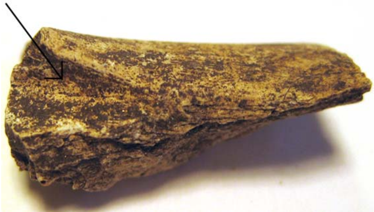
Fig. 3. Bäckenbensfragment från får/get med den könsindikerande fossa musculus markerad med en pil

Epifyssammanväxningen för falanger sker mellan 6-9 månader och för distala delen av skenbenet vid 15-20 månaders ålder. Detta innebär att av materialet att döma har man inte slaktat ungdjur vid platsen. Det fanns också bevarat en del av ett bäckenben från får/get vilket öppnar upp för möjligheterna att göra en könsbedömning. Då det rör sig om ett litet fragment med enbart en könsindikerande karaktär ( fossa musculus ) bevarad är det svårt att med säkerhet bedöma könet. Den könsindikation som ges av fragmentet tyder dock på att det rör sig om en tacka/get.