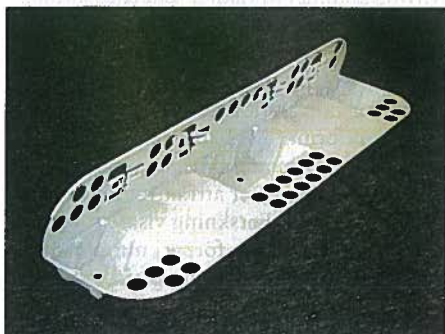
Ikeas lastlist. Lastlisten är en logistikdriven förpackningsinnovation som reducerar både kostnad och miljöpåverkan i hela kedjan.

Nyckeln till effektiva varuflöden är välfyllda lastutrymmen och välanpassade förpack-