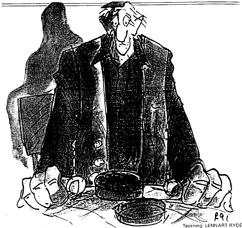
Teckning: LENNART RYDÉN