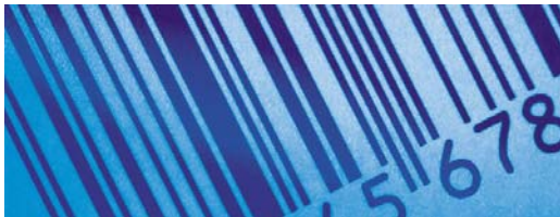
En traditionell streckkod

Alla världens länder har lagar och regler som bestämmer vad man får använda olika frekvensområden till. För att kunna använda sig av RFID i handeln behövs en global standard som beskriver vilken frekvens som ska användas. Nyligen fastslogs en frekvens standard för RFID i Europa. Den är liknande standarden i USA och detta är ett steg mot en global frekvens standard för RFID. Nu återstår det att få med Asien och Kina för att åstadkomma en global frekvens standard.