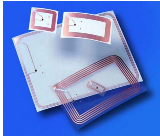
Exempel på olika RFID-chip.

Inom handeln storsatsar amerikanska Wal-Mart, tyska Metro, franska Carrefour och brittiska Tesco på att märka sina varor med RFID-chip. De har börjat med att märka pallar och gruppförpackningar. Tanken är sedan att märka enskilda varor. Wal-Mart hoppas att spara miljarder dollar årligen på minskade arbetskostnader, lager och stölder. På 80-talet var Wal-Mart en pådrivare av streckkoder. Många tror att samma sak kommer att ske med RFID-