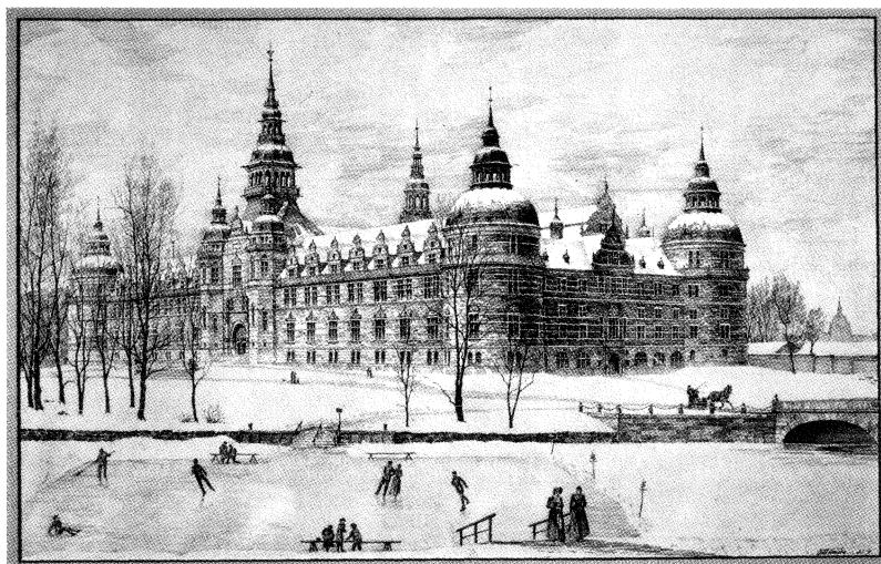
Arkitekten Isak Gustaf Clason förslag från 1891 till Nordiska Museets byggnad, tecknat av Gustav Améen. Huset var halvfärdigt till Allmänna Konst- och Industriutställningen i Stockholm 1897, och invigdes i juni 1907.

ning verkade tendenser som hade koppling till emigrationsfrågan. Under det sena 1800-talet hade strömmen av emigranter från Sverige varit mycket stor, kulmen nåddes under tidigt 1900-tal. Det framstod nu som ett nationellt intresse att förmå unga friska medborgare att stanna inom landet. För att stärka tilltron till ett bättre liv i framtiden var bostadsfrågan helt central. Nationalföreningen mot emigrationen satsade starkt på att föra fram goda exempel på bostäder för arbetarfamiljer, främst i form av så kallade egnahem. I dessa strävanden bidrog en del av de unga arkitekter, som snart skulle bli tongivande i svensk arkitektur. Genom att rita förslag till bostadshus, kom de också att illustrera hur ett bättre liv i Sverige skulle kunna se ut. Ett exempel är arkitekten Torben Gruts lilla röda stuga med vita knutar, försedd med en vit stång för den blågula flaggan. Det var ett av svaren på en socialt brännande fråga, samtidigt till sitt yttre väl förankrat i en tryggt nationell form. I samma riktning verkade Carl och Karin Larssons inredning av sitt hem i Sundborn, som kom att inkarnera något av det mest svenska som finns. Det visar hur en konstnärligt gestaltad miljö infogades i bilden av en nationell identitet. Arkitekter och konstnärer besatt alltså ett mäktigt verktyg genom sin förmåga att visualisera drömmar och möjligheter.