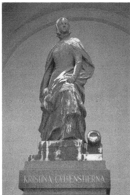
Statyn över Kristina Gyllenstierna avtäcktes i november 1912 på Stockholms slotts yttre borggård.

fosterlandet, med tankar om kvinnlig rösträtt. Det var inte heller enbart moderskapet man lyfte fram. Visserligen betonades vid avtäckandet av statyn att Kristina Gyllenstierna varit en god och ömsint maka, men hon tilläts dock i händelse av en krissituation att träda in på männens arena, åtminstone om hon efter utfört dåd drog sig tillbaka till sin rätta sfär igen. 39