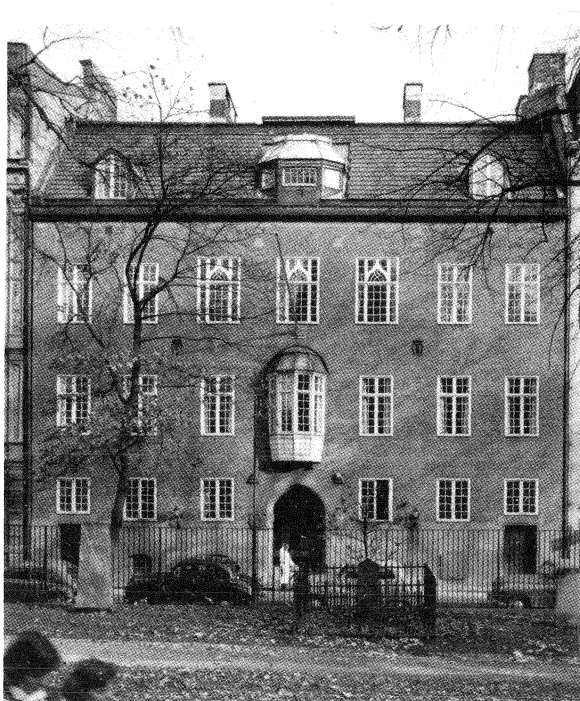
Läkaresällskapet hus i Stockholm, ritat av Carl Westman.

symbolvärde, som stadshus och rådhus. Det gällde där att gestalta monumentalitet, värdighet och offentlighet utan hjälp av stilhistoriska mönster. En passande förebild ur det nationella formförrådet blev då 1500-talets Vasaslott som Vadstena slott med kraftiga murar, släta ytor och klara volymer. Ideal som var väl förenliga med Arts and Crafts. Genom en sådan inhemsk förlaga kunde alltså internationella signaler på det estetiska området införlivas med nationella associationer, något som idémässigt också låg i tiden. Det främsta exemplet är Carl Westmans rådhus i Stockholm, färdigt 1914.