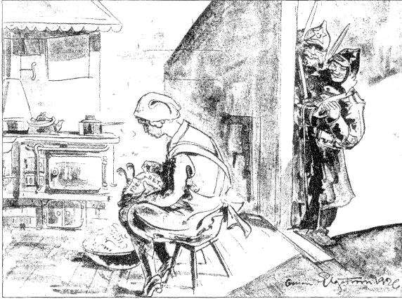
Försvaret plockas. Tecknad av Ossian Elgström. Från Sveriges försvar 1926:1.

Ett minskat försvar medförde enligt högern ett hot mot familj, äktenskap och goda seder. Hotet kom inte bara utifrån, det vill säga från Sovjetunionen, utan även inifrån, framför allt från socialistiskt håll. Dessa två hot förenades så att det ena blev en förutsättning för det andra. I riksdagsvalet 1928, det så kallade kosackvalet, förknippades hotet mot hemmet med rädslan för en militär invasion från Sovjet på ett mycket effektivt vis. På högerns valaffischer från 1928 utgjorde de vilda, röda kosackerna ett hot mot hemmet, kvinnorna och barnen. En traditionell rädsla för Ryssland användes för att utmåla det nya hotet Sovjetunionen och man tog fasta på fruktan för socialismen. Affischerna utnyttjade också symboler för det som ansågs representera det goda nationella Sverige, främst familjen och hemmet. 11