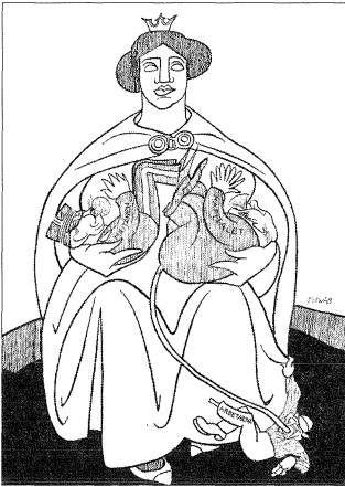
Moder Svea i Naggen 1913:5. Tecknare Eigil Schwab.

I bilden av den ammande Svea intar bröstet en viktig roll. Från bröstet kommer den närande mjölken och det är tillgången till bröstet som är bildens centrala tema. Marilyn Yalom visar i sin bok om bröstens historia hur den ammande modern har använts i politiska sammanhang sedan 1700-talet. Det goda modersbröset förknippades ursprungligen med familjen och samhällets nydaning. Att själv amma sina barn associerades med medborgerliga plikter; därmed blev amning också ett politiskt ställningstagande. 47 Bröstens närande funktion är också tydlig när Svea skildras som ammande, även om hon ammar "fel" barn. Flera framställningar av