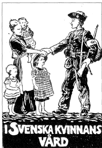
Kvinnorna och landets brevkort. Bilden publicerades även i ett flertal tidningar, till exempel i Aftonbladet 7/8 1914.

Den starka kvinnan som stannade kvar och skötte sin del av arbetet och reproduktionen, medan mannen gav sig av för att strida för hemmet illustreras också av ett brevkort som Kvinnorna och landet gav ut till förmån för landstormens beklädnad i augusti 1914. På bilden tar en landstormsman avsked av sin kvinna som står med ett barn i famnen och två i kjolarna. Avskedet sker i form av ett handslag och därmed befästs arbetsfördelningen mellan makarna. Under bilden står: ”I svenska kvinnans vård”. 20 Mannen är visserligen den som ger sig ut för att försvara fosterlandet, men kvinnan har också en uppgift. Den kvinnlighet som konstrueras genom denna bild är den starka, självmedvetna modern, viss om sin stora betydelse för nationens fortbestånd.